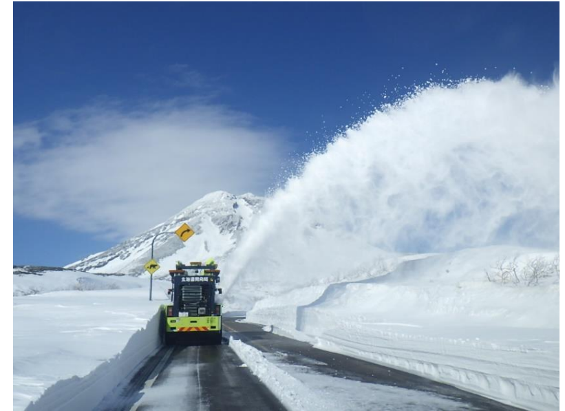
一度除雪した箇所を再度除雪しております