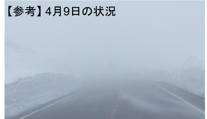
荒天のため作業を中止しました