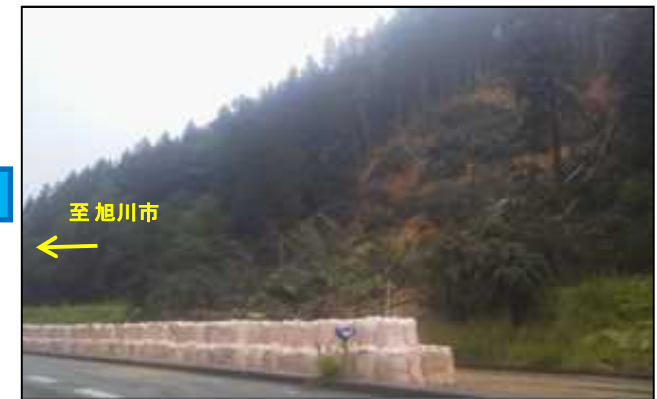
H28.8.27 8:00～ 片側交互通行 (昼間のみ8:00～17:00)開始