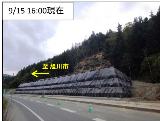
H28.9.18 8:00～ 終日対面通行可能