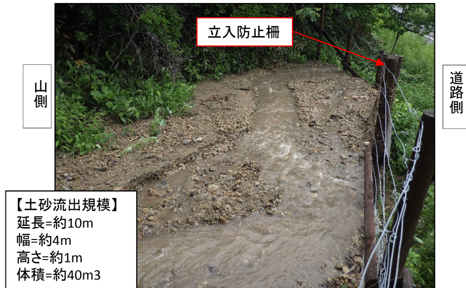
旭川・紋別自動車道 被災状況