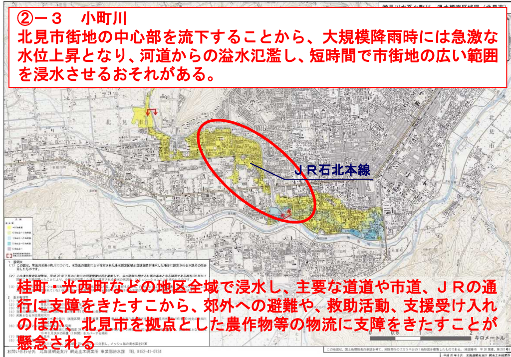
図 想定される被害の特徴 （常呂川水系 小町川（道管理））