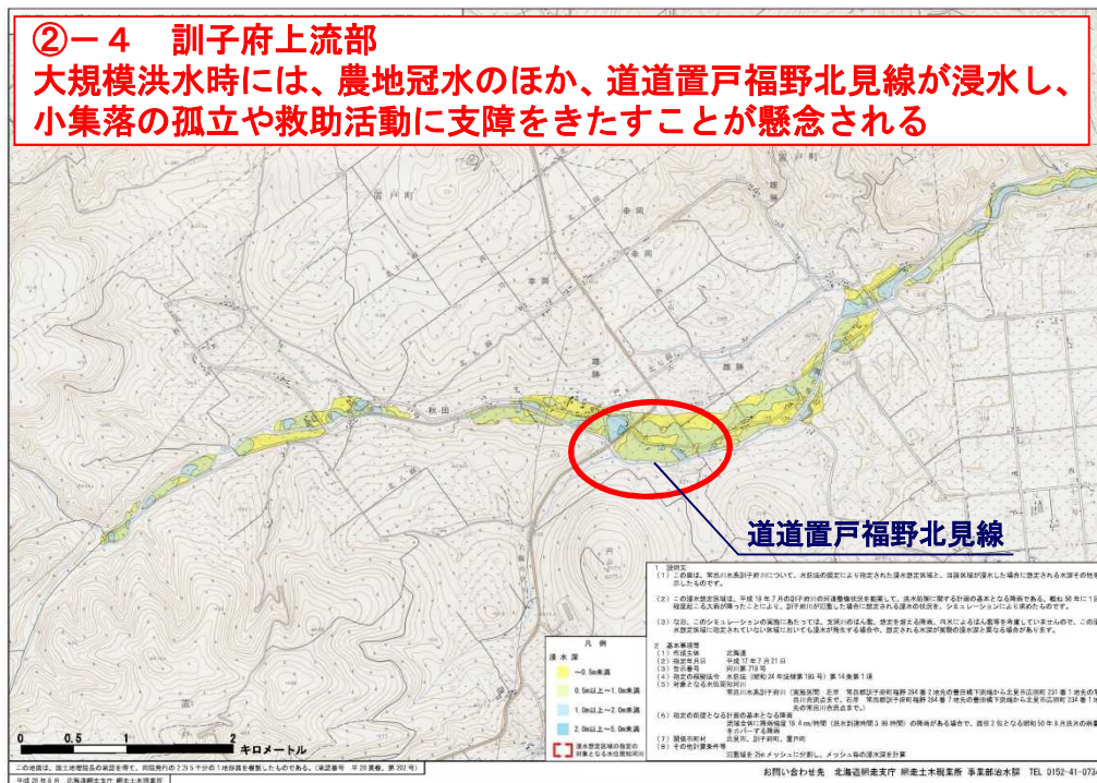
図 想定される被害の特徴 (常呂川水系 訓子府川 (道管理))