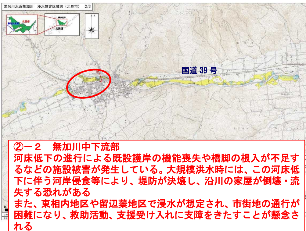
図 想定される被害の特徴 （常呂川水系 無加川（道管理区間））