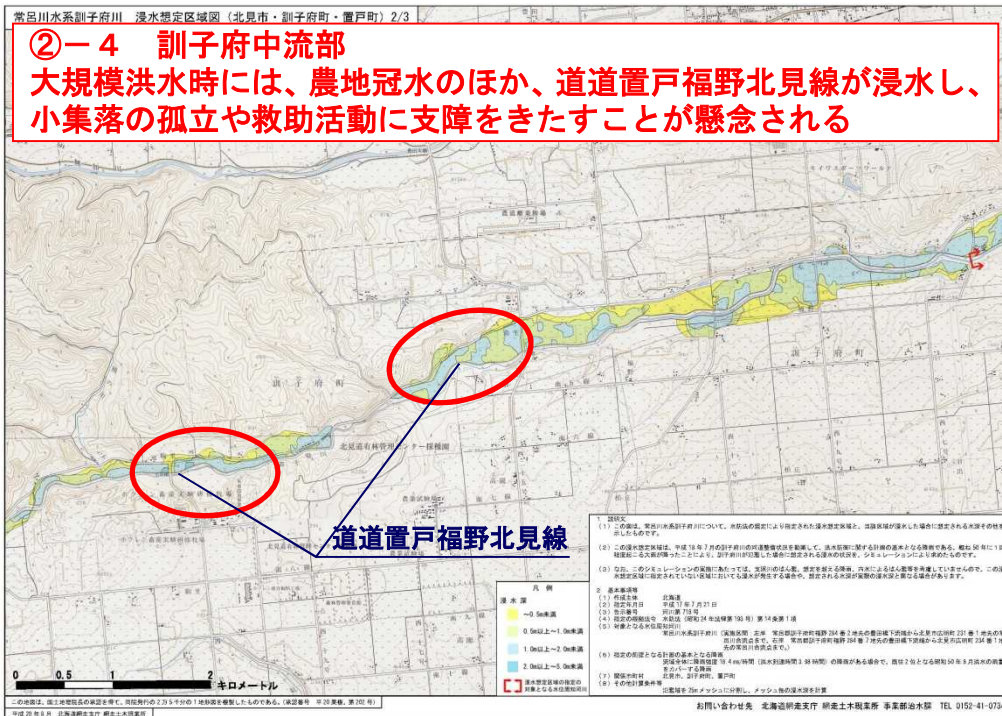
図 想定される被害の特徴 (常呂川水系 訓子府川 (道管理))