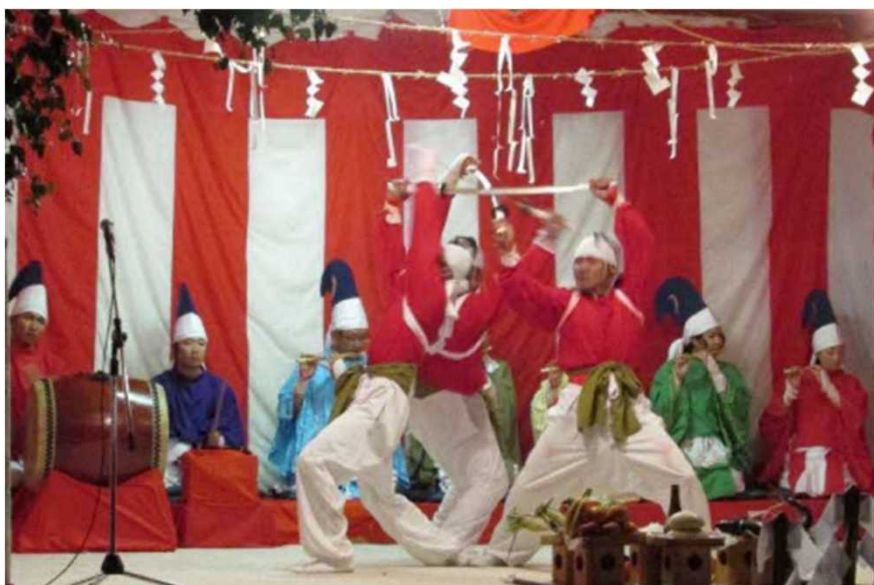
114年の間、一度も休まず続く豊郷神楽の奉納（毎年8月1日）