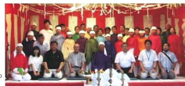
様々な担い手による神楽の伝承

神楽の踊り手は豊郷集落の農家の長男に限定されていたことから、100年目の記念講演時には13名と存続の危機に直面したため、会員の対象者を男女や市内在住を問わず広げて募集し、小学校の授業で踊りを習った経験のある中高生も含めて、合同で神楽を継承しています。地域の芸能祭や姉妹友好都市との交流時など、地域内外と積極的に交流することにより認知度を上げ、郷土芸能として広く市民に理解されてきました。