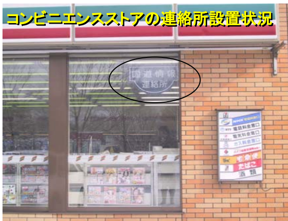
コンビニエンスストアの連絡所設置状況