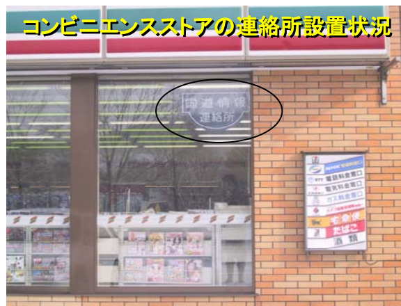
コンビニエンスストアの連絡所設置状況