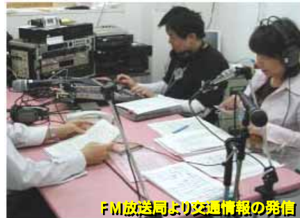
FM放送局より交通情報の発信