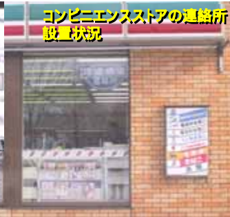
コンビニエンスストアの連絡所設置状況