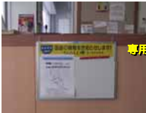
ガソリン給油所の連絡所設置状況