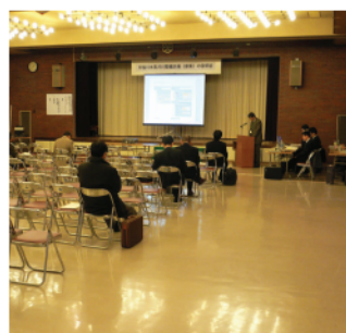
音威子府村公民館