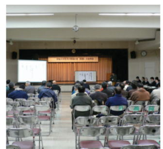
中川町山村開発センター集会室