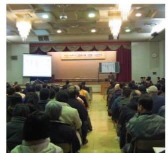
下川町民会館大ホール