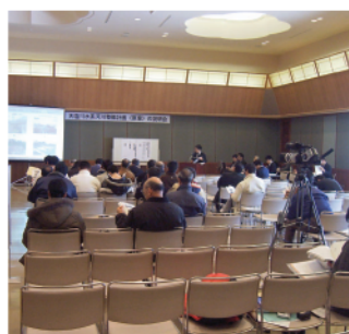
美深町文化会館COM100小ホール