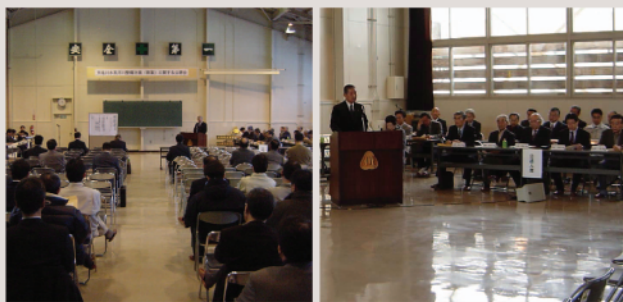
上川北部地域人材開発センター（名寄市）