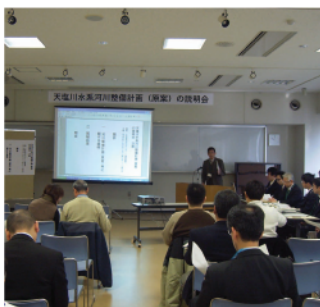
士別市民文化センター1階研修室