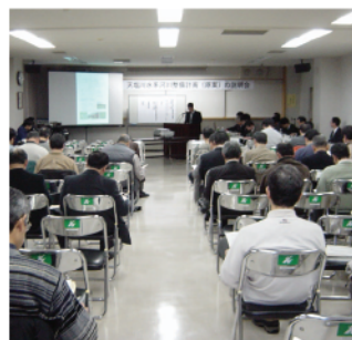
名寄市民文化センター大会議室