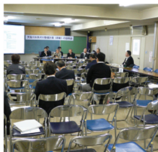
天塩町社会福祉会館