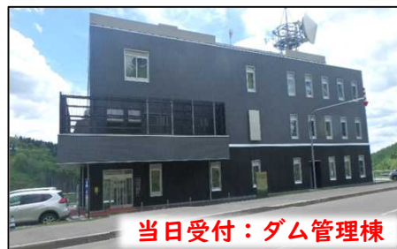
当日受付：ダム管理棟