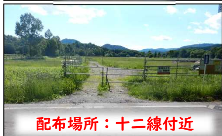
配布場所：十二線付近