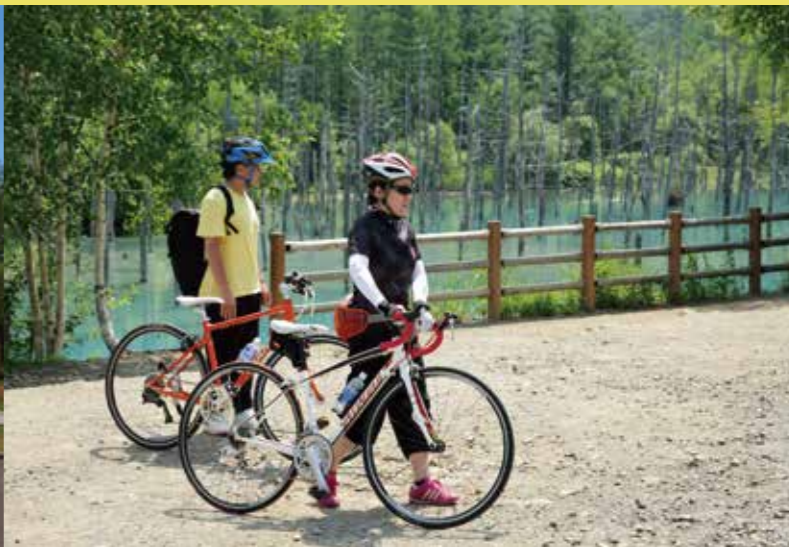
① 起点:四季の橋 上流【0km】