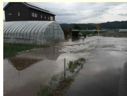
漏水により宅地が湛水