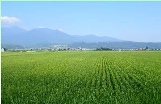
十勝岳連峰を望む田園風景

本地域は、上川総合振興局管内の富良野市及び空知郡中富良野町に位置する農業地帯である。地域の営農は水稲を中心に小麦のほか、たまねぎ、メロン、にんじん等の野菜類を組み合わせた複合経営が展開されている。