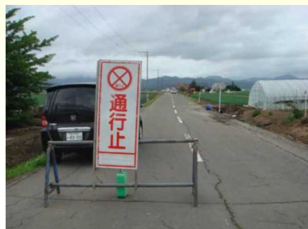
町道復旧のため通行止め