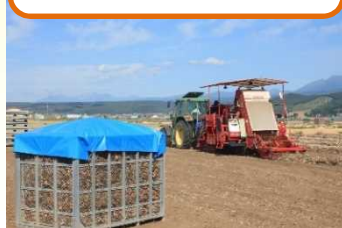
たまねぎ収穫(たまねぎピッカー)