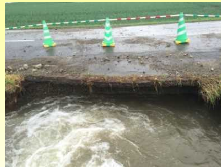
漏水により隣接町道が流亡