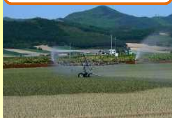
たまねぎへの散水状況