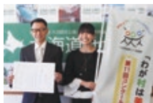
にじいろファーム(七飯町)

詳しくは、二次元コードから「わが村は美しく-北海道」運動のページをご覧ください。