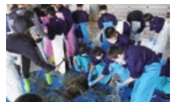
地元中学生の網外し体験(砂原地域)

第3種・4種漁港を中心とする道内各地域では、地域が有する固有の資源を活用しつつ水産業を核とした地域振興策となる「地域マリンビジョン」を策定し、様々な取組を推進しています。