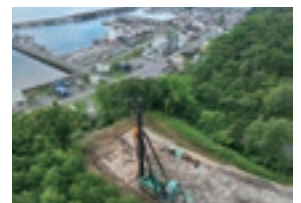
臨港道路整備状況(白尻地区)