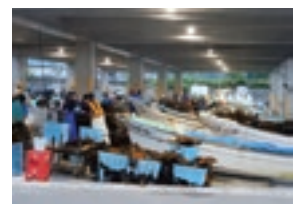
マコンプ水揚げ(福島地区)