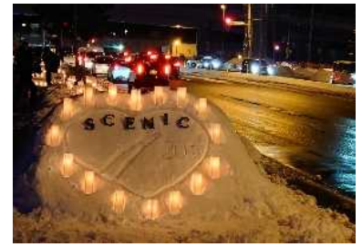
函館新道 シーニック de ナイト

管内では「函館・大沼・噴火湾ルート」と「どうなん・追分シーニックバイウェイルート」の2つが指定ルートとなっており、地域の魅力を高める活動が行われています。