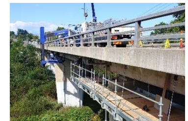
老朽化対策（橋梁補修）

（注：重大な災害の発生または発生のおそれがある場合に情報収集等を目的として地方公共団体へ派遣する職員）