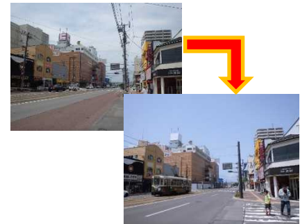
国道278号 無電柱化状況

道路の防災性の向上、安全で快適な歩行空間の確保、良好な景観の形成や観光振興の観点から実施している電柱の新設抑制及び無電柱化について、低コスト技術等を積極的に導入しつつ、事業のスピードアップを図ります。