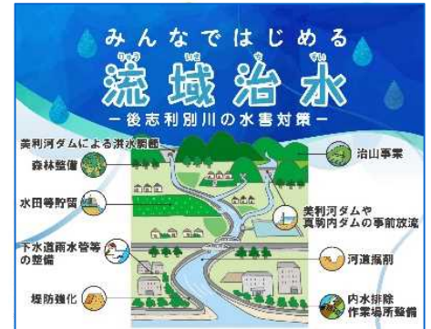
「流域治水」の施策のイメージ

また、川の自然環境や景観、水辺の活動、サイクリング環境等、川に関する情報を効果的に発信するとともに、地域と連携して、魅力的な水辺空間の創出、水辺利活用を促進し、北海道らしい地域づくり・観光振興に貢献する「かわたびほっかいどう」プロジェクトを推進します。