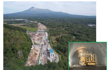
北海道縦貫自動車道 七飯～大沼

広域分散型社会を形成している北海道において、食・観光等の基幹産業を支えるとともに、国土の強靱性を確保し、地域間の連携強化を図るため、高規格道路ネットワークの整備を推進します。