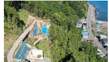
国道278号 尾札部道路