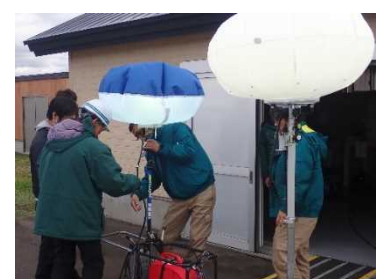
防災訓練 道の駅「上ノ国もんじゅ」

また、「道の駅」の交通結節点化や防災拠点化など、地域の拠点化に向けた多様な取組を推進します。