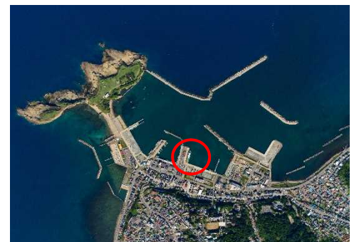
江差港フェリー岸壁の整備

地方港湾奥尻港ほか4港では、老朽化した施設の機能回復、港内静穏度の確保等、港湾の効率的な利用を図るため、物揚場、防波堤、泊地等の整備を進めます。