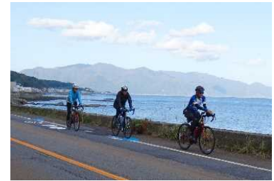
「どうなん海道サイクルルート」

世界水準のサイクルツーリズム環境の実現に向け、令和5年度にサイクルルートに追加された「どうなん海道サイクルルート（道南サイクルツーリズム推進協議会）」等、地域と連携し、安全で快適な自転車走行環境の改善やサイクリストの受入環境の充実、情報発信及び地域独自の取組など、官民一体となって推進します。