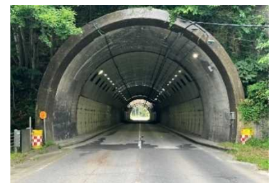
道路照明灯のLED整備状況

地球温暖化防止が重要な政策課題となっている中で、北海道の豊かな自然や地域資源を活かしてグリーン社会の実現を主導していくことが求められています。ゼロカーボン北海道の実現に向けた取組を推進し、道路照明灯をLED化するとともに、設置間隔を広げることにより消費電力を削減し、CO2排出量の削減を推進します。