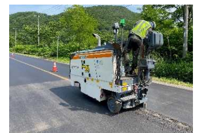
交通安全対策 （ランブルストリップス）

* 事故ゼロプラン：交通事故の危険性が高い区間である「事故危険区間」の交通事故対策の取組。