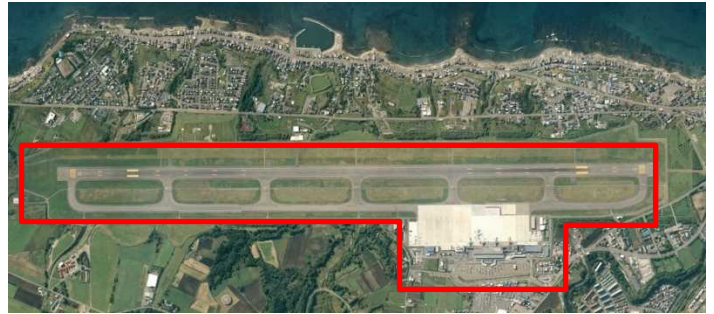
函館空港 浸水対策整備箇所

函館空港では、豪雨による空港施設の浸水を防止するため、排水機能強化による浸水対策等を行います。