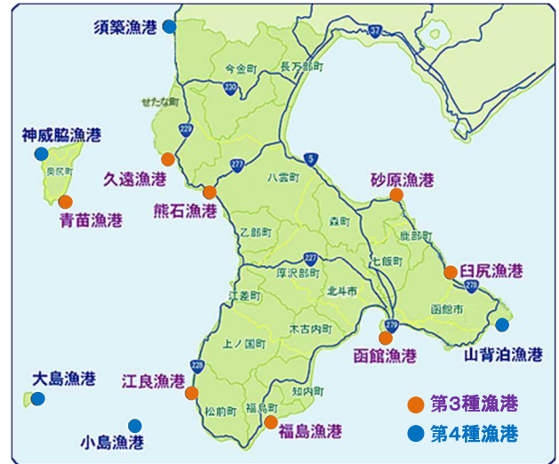
令和7年度 水産基盤整備事業の概要

令和7年度は、「水産業の成長産業化に向けた拠点機能強化対策」として岸壁や道路の整備、「持続可能な漁業生産を確保するための漁港施設の強靱化・長寿命化対策」として防波堤や護岸、泊地などの整備を推進します。