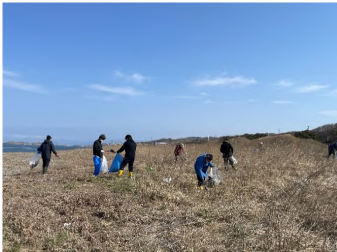
かもめ島を望むことができる榎川駐車場海岸沿いを清掃しました。