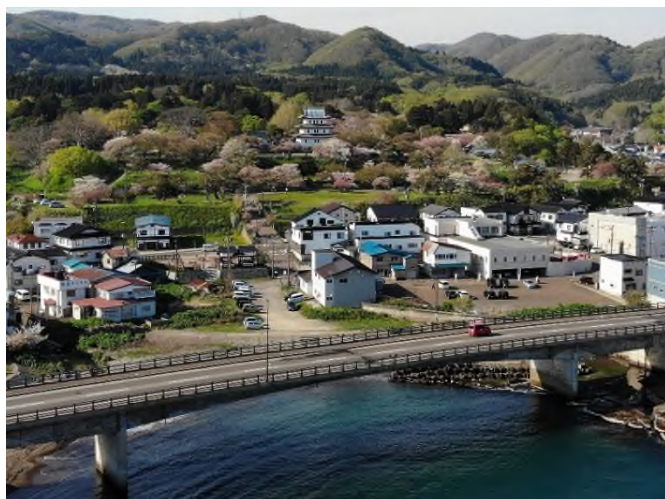
国道228号松前町白神～松前町札前 松前城と桜