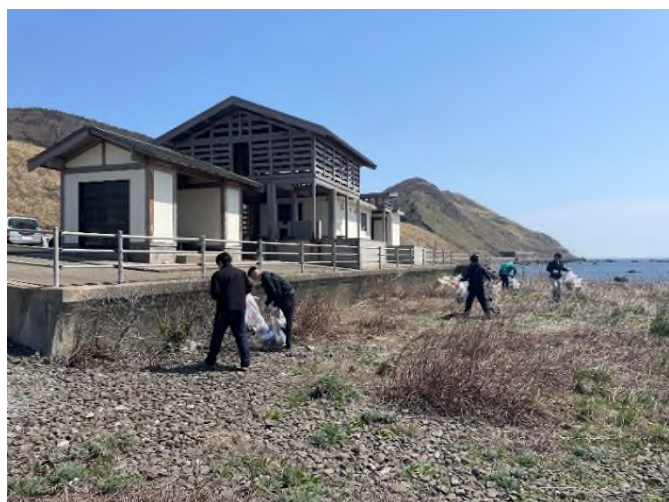
白神岬からの景色を多くの人に楽しんでいただくため、地域の方々が清掃活動に励みました。