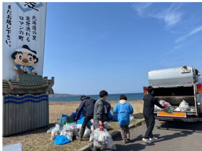
天気にも恵まれ、たくさんの地域の方々にご参加いただきました。