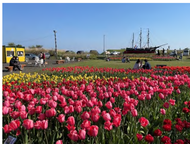
きれいになったサラキ岬では、5月頃にチューリップが満開となり、訪れる方々の心を癒します。(昨年度のチューリップフェアの様子)