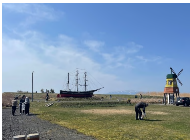
当日は多くの方が集まり、5月のチューリップフェアに向けて、清掃活動に励みました。