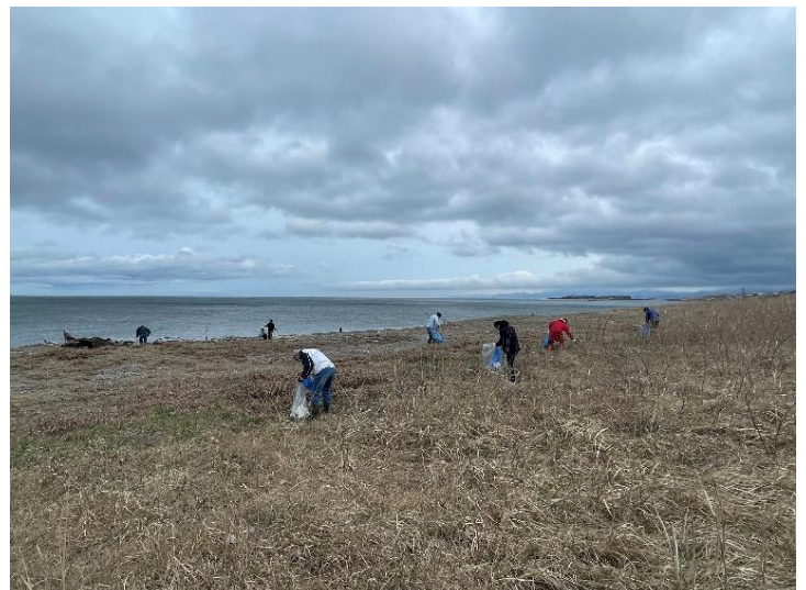
たくさんの地域の方々にご参加いただきました。