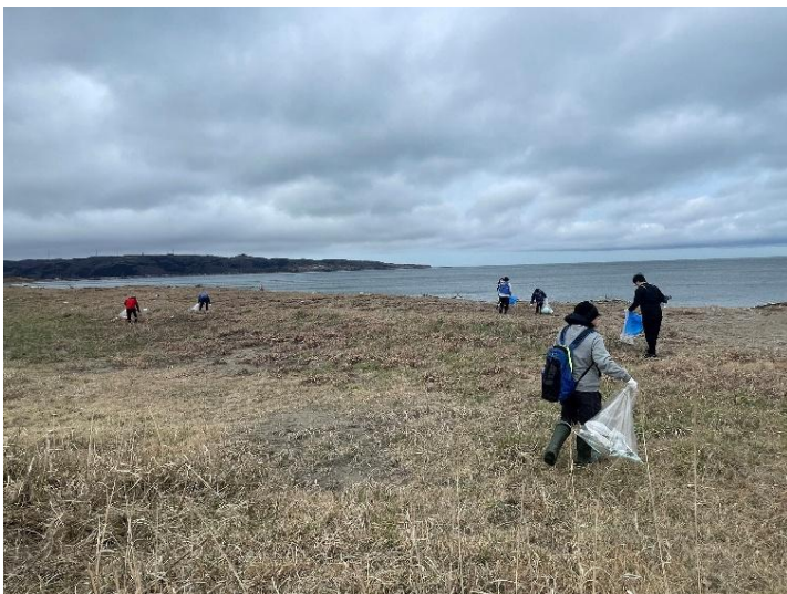
かもめ島を望むことができる榎川駐車場海岸沿いを清掃しました。