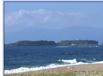
榎川駐車場から望むかもめ島