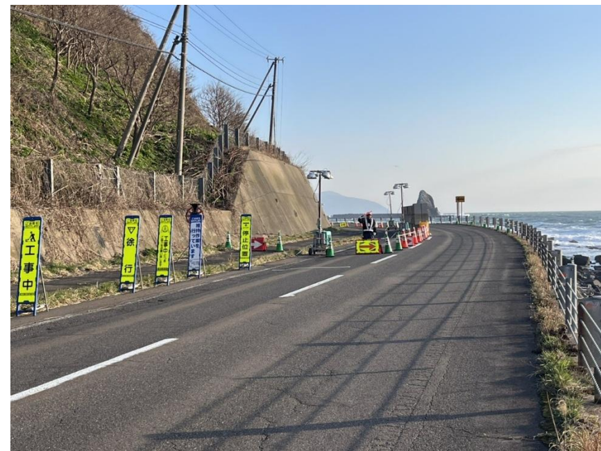
片側交互通行の状況