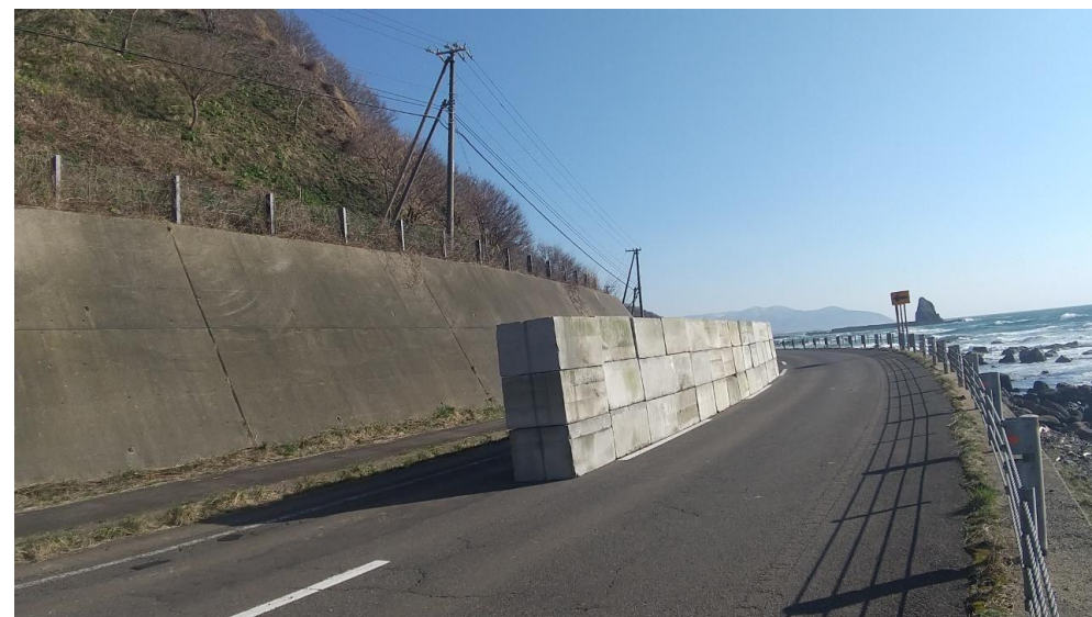
コンクリートブロックの設置状況