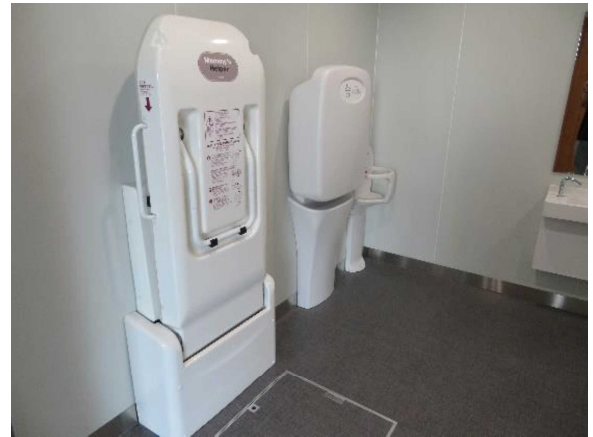
▲おむつ交換台及びベビーチェア(多目的トイレ)