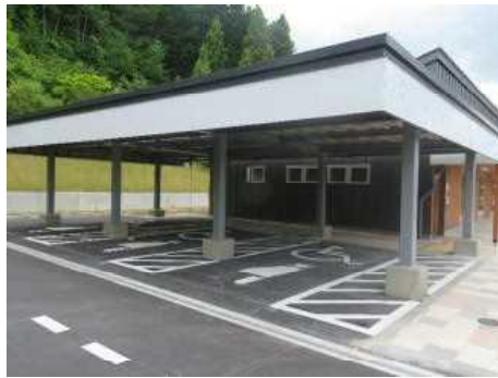
妊婦向け屋根付き優先駐車スペース