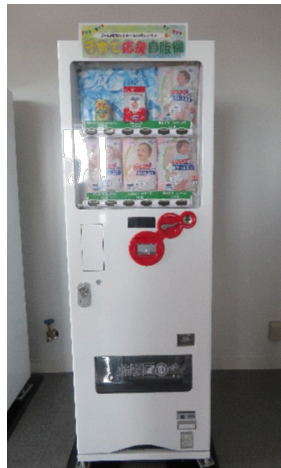
子育て応援自動販売機