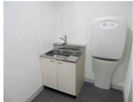
24時間利用可能なベビーコーナー (授乳室)