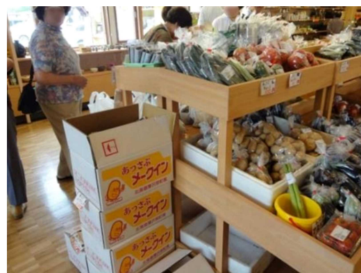
▲特産品のメークインも並ぶ直販コーナー