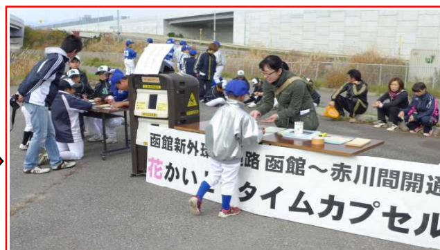
▲子どもたちが、未来へ希望を込めて手紙を書きました。