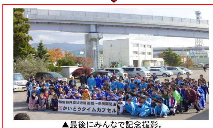
▲最後にみんなで記念撮影。