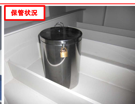
▲書いた手紙は、函館ICの橋の中に置き、保管されていました。