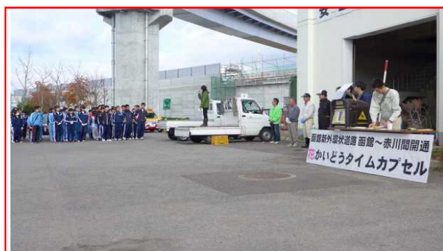
▲植栽活動後、スポーツ少年団の子どもたちによりタイムカプセルイベントを実施。