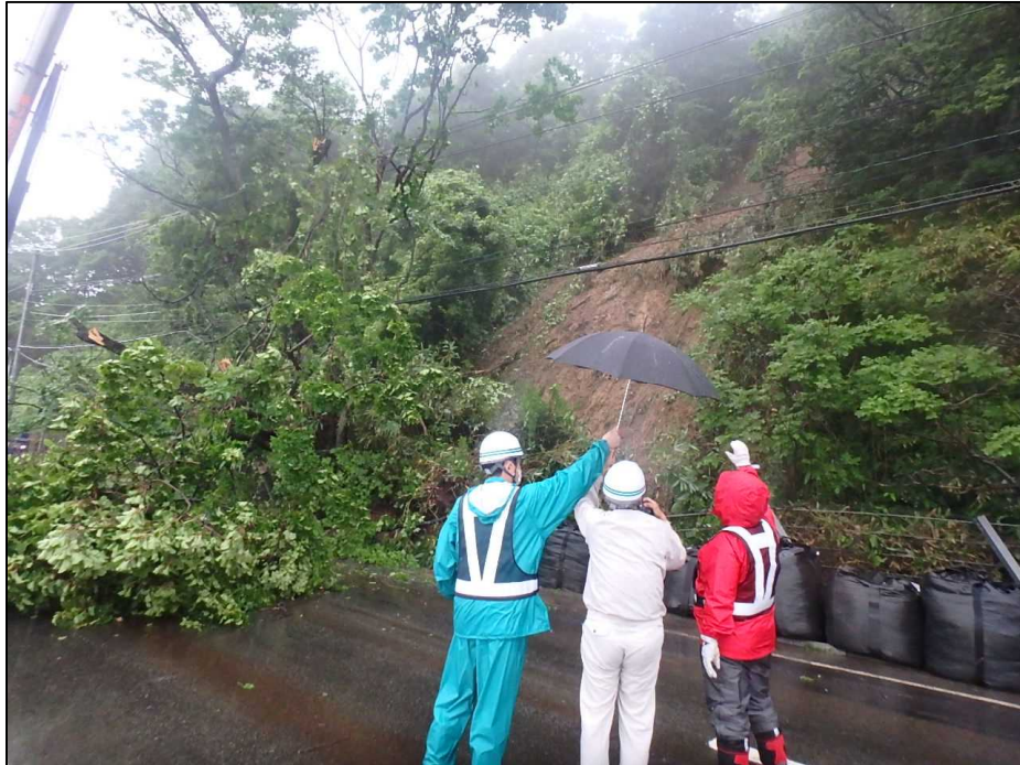
専門家による現地調査