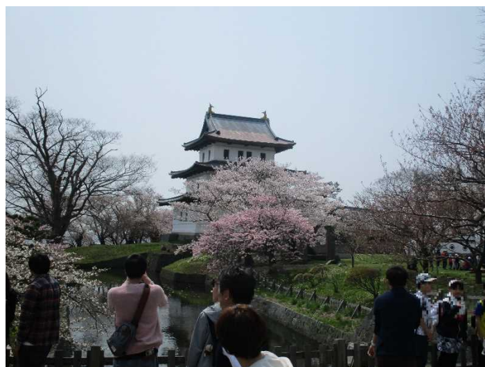
桜の時期には多くの観光客が訪れます。