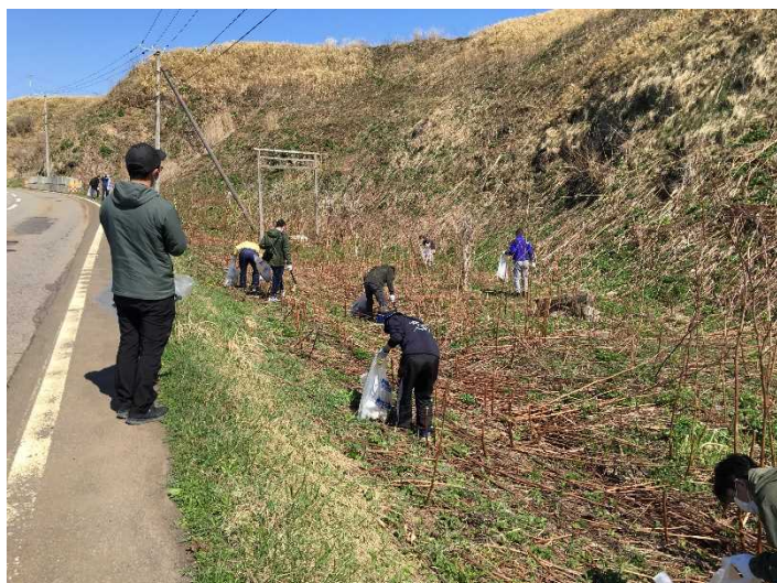
子供から大人まで地域の方々が清掃に参加しました。