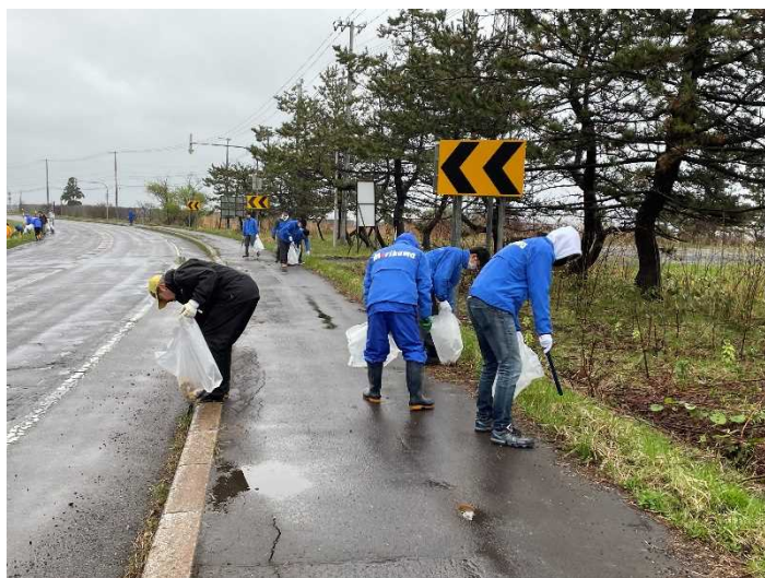
あいにくの天気でしたが、木古内町の各実施場所で地域の方々が清掃に参加しました。