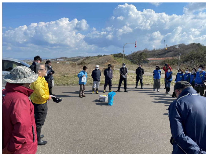
清掃前の挨拶の様子。 天気にも恵まれ、たくさんの地域の方々にご参加いただきました。