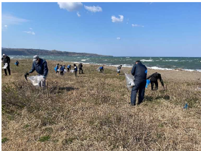
かもめ島を望むことができる榎川駐車場海岸沿いを清掃しました。