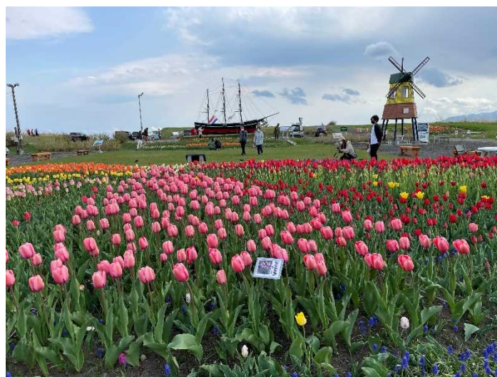
きれいになったサラキ岬では、5月頃にチューリップが満開となり、訪れる方々の心を癒します。(過年度のチューリップフェアの様子)