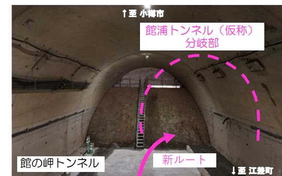
トンネル分岐部の状況（9月撮影）

11月25日にトンネル工事が契約となり、令和8年春頃から掘削を開始する予定です。