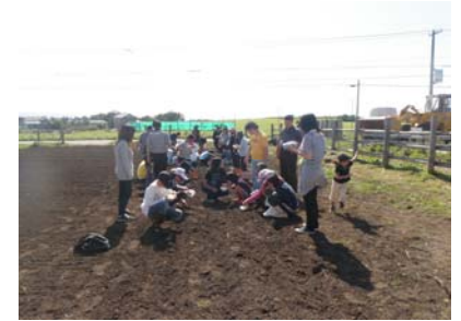
酪農公社の一角に広がる菜の花畑と種まき