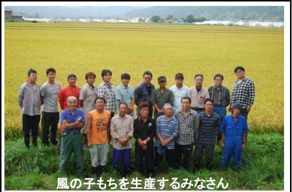
風の子もちを生産するみなさん