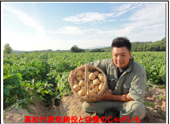
高松代表取締役と自産のじゃがいも