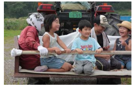
農業体験と夏祭りの様子