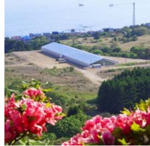
太陽熱と温泉熱で育ついちごと恵山から見た温室プラント