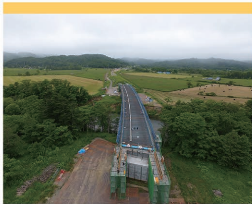
北海道横断自動車道 本別～釧路