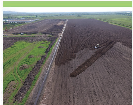
区画整理 排水路及び基盤整備状況(阿寒地区)