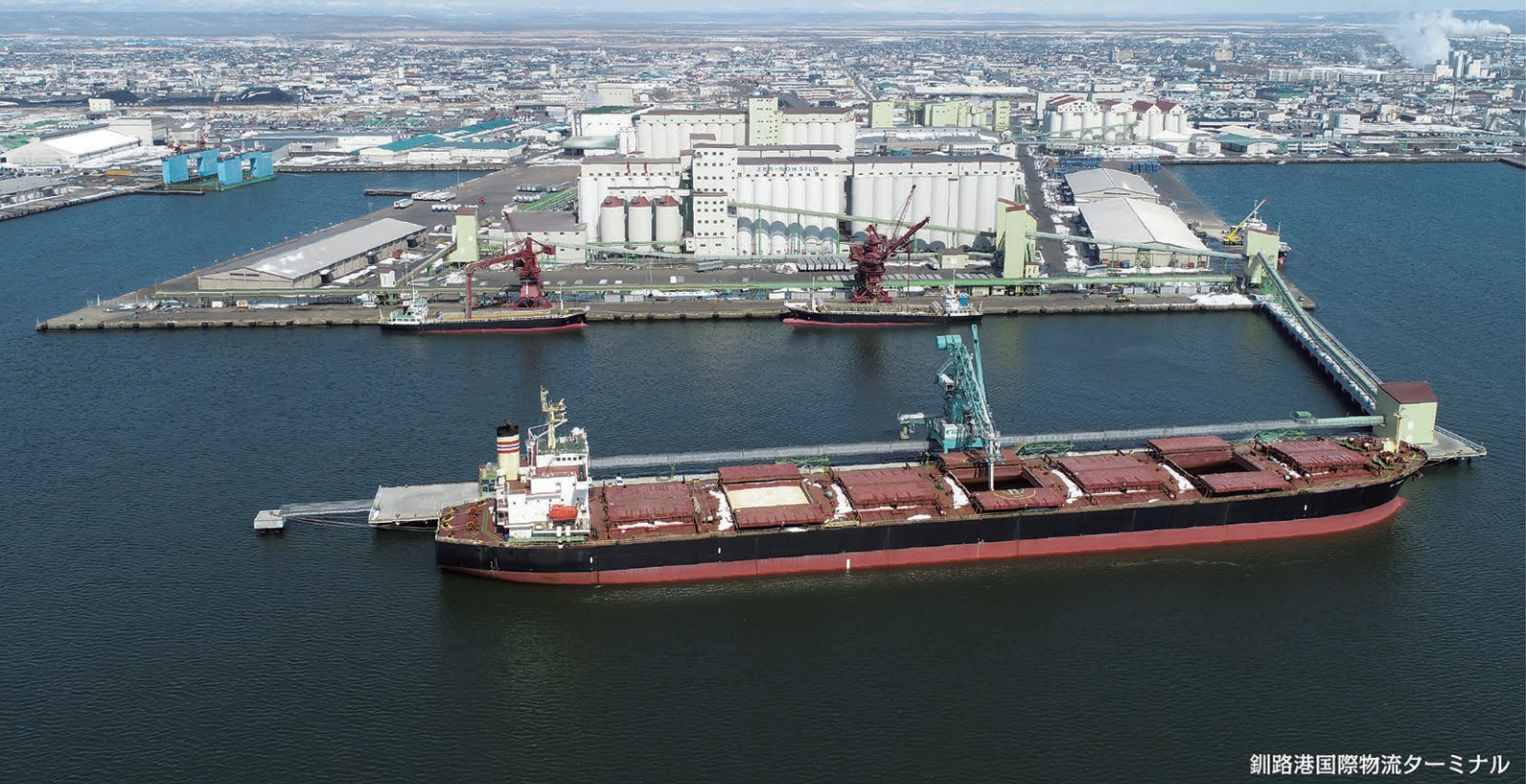
釧路港国際物流ターミナル