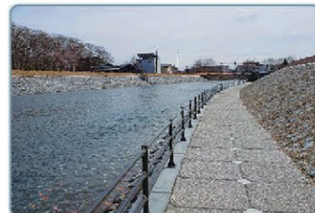
釧路川の河川改修状況