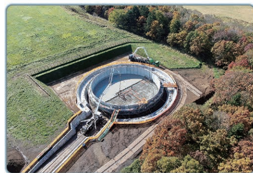
肥培かんがい施設整備状況(別海北部地区)