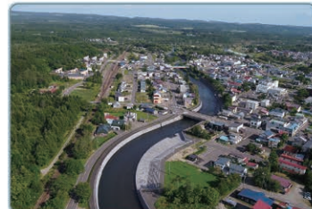
釧路川の河川改修状況