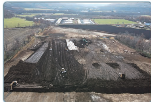
大区画整理基盤整備状況(阿寒地区)