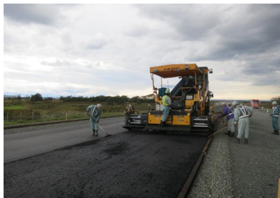
アスファルト安定処理 舗設状況