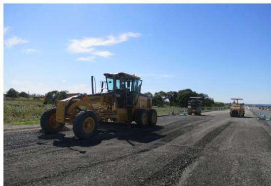
下層路盤 仕上状況