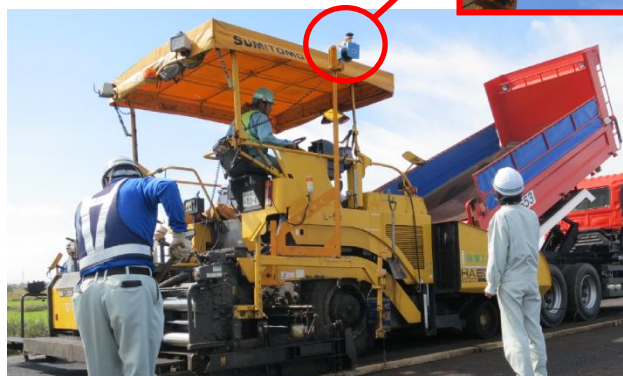
RSS(ロードスキャナシステム)