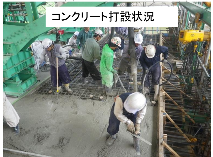
コンクリート打設状況