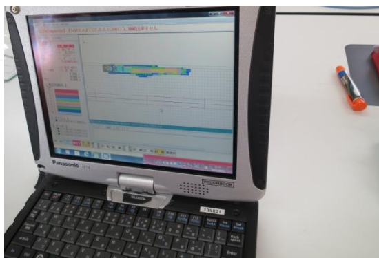
締固め管理 (IT通信技術)