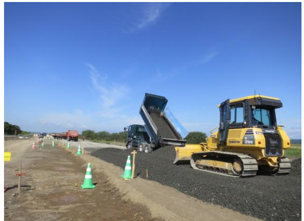
下層路盤敷 施工状況