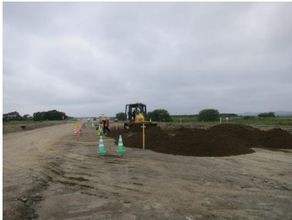
凍上抑制層 施工状況