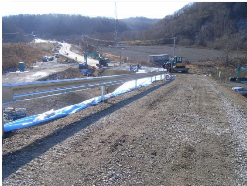
地域貢献(達古武キャンプ場歩道柵補修)