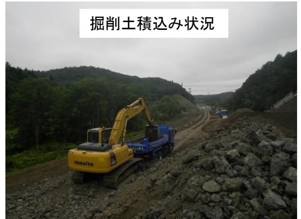
掘削土積み込み状況