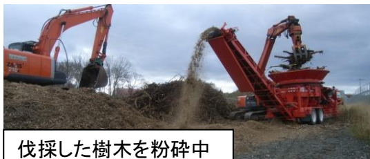
伐採した樹木を粉砕中