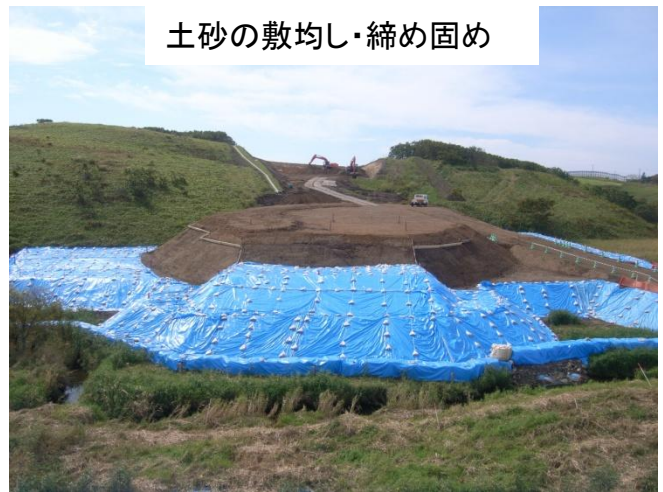
土砂の敷均し・締め固め

イメージアップの一環として国道44号線沿いに大型電光掲示板(LED照明)を設置し、交通事故防止の啓発を実施しています。