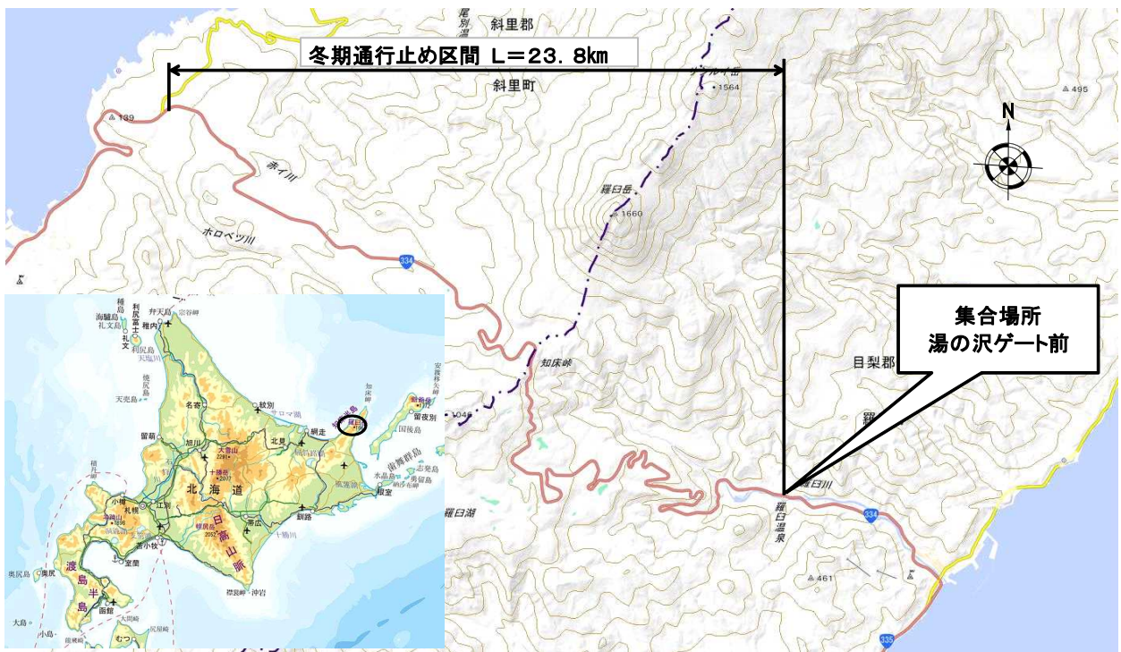
集合場所図（国道334号と国道335号の交点から知床峠方向へ約3.5km地点）