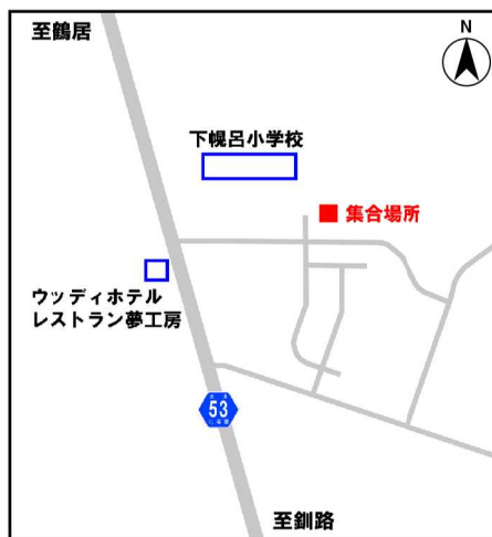
集合場所：下幌呂コミュニティセンター (鶴居村字幌呂下幌呂)