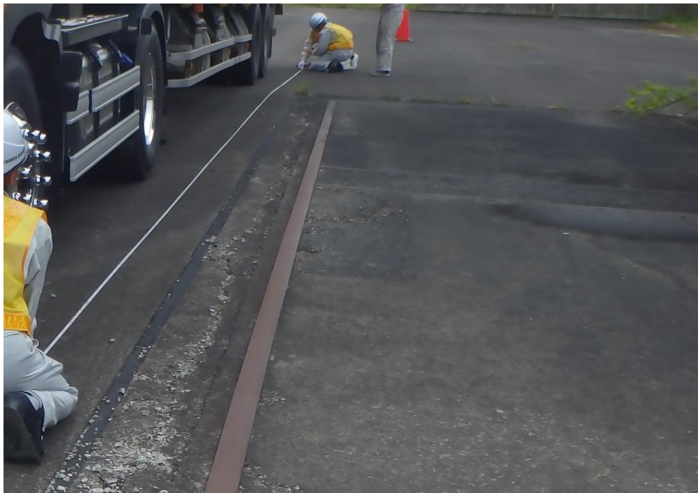
車両の重量の計測