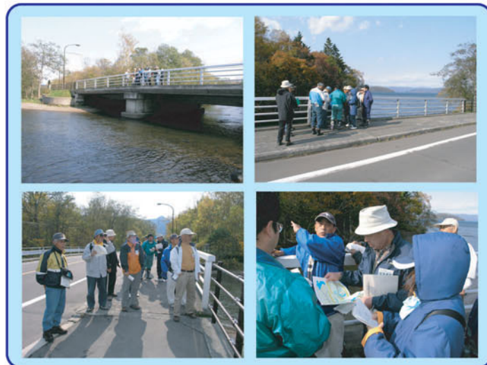
釧路川の流れ出し「眺湖橋」にて