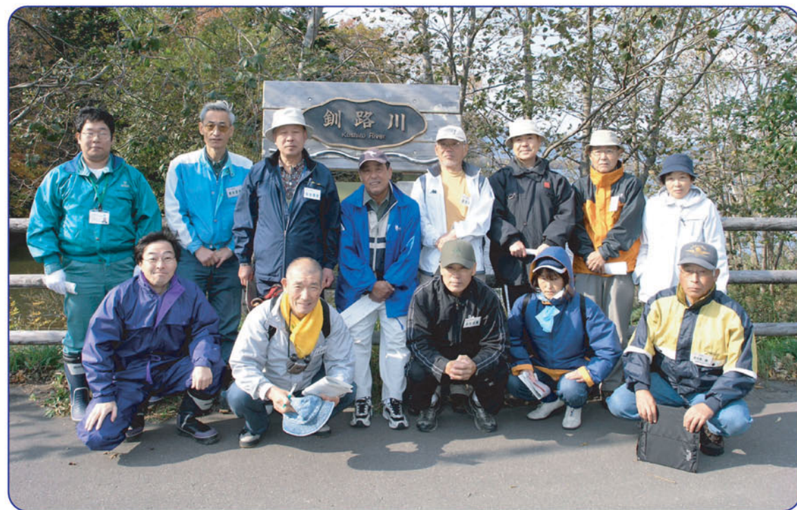
釧路川の水質調査に参加した川レンジャーのみなさん