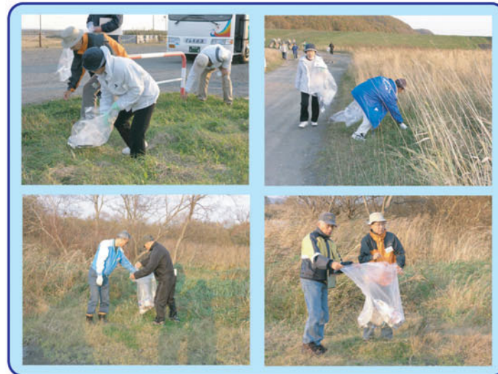
岩保木でのゴミ拾い