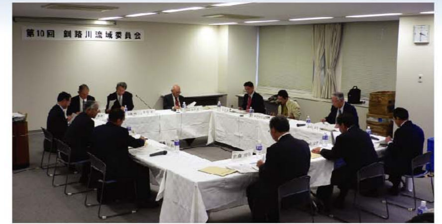
▲第10回釧路川流域委員会の様子

北海道開発局及び北海道では、今後概ね20～30年間の具体的な河川整備の内容を示す「釧路川水系河川整備計画」を策定するに当たり、河川法第16条 2項に基づき、学識経験者等から意見をいただくことを目的として「釧路川流域委員会」を設置しています。