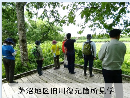
茅沼地区旧川復元箇所見学