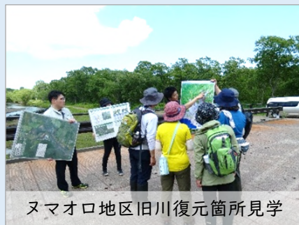
ヌマオロ地区旧川復元箇所見学