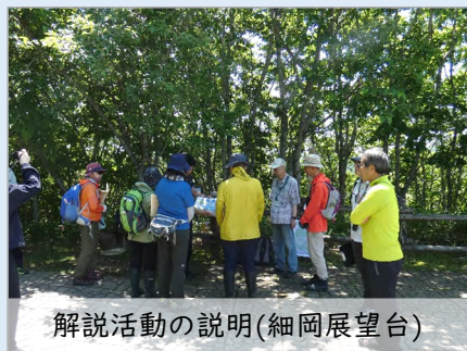
解説活動の説明(細岡展望台)

令和7年度は、新たに5名が加入し、くしろ自然再生解説員は24名で解説活動を行っていただきました。6月28日(土)には、解説員及び解説員登録希望者を対象に、細岡展望台で説明会と実践的なレクチャーを行った後、自然再生事業地(茅沼地区旧川復元箇所、ヌマオロ地区旧川復元箇所)の現地見学会を行いました。