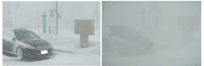
暴風雪であつという間にすぐ近くが見えなくなる (右) 稚内市内 (平成24年4月4日)