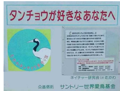
図-9 タンチョウ見守り隊の看板（平成28年6月設置）

一つ目として、鶴川河口周辺には、近年タンチョウが生息しており、同会は「タンチョウ見守り隊」としてタンチョウと共存を呼びかける看板を設置する際、占用申請について河川協力団体の場合、協議をもって足りることから「速やかに設置でき、協力団体になって良かった」と感想を受けた。（図-9）