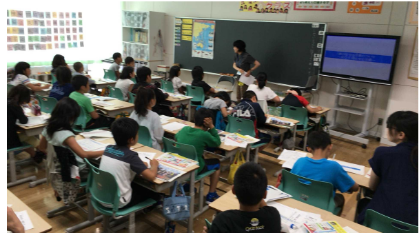
図-10 むかわ町内小学校での出前講座

二つ目として、室蘭開発建設部が受けた「むかわ町内小学校での出前講座（鶴川河口の環境保全について）」であるが、講義で「地域を守る活動」の要望があり、実際に活動している同会と連携して実施したことにより、より良い講義とすることができた。（図-10）