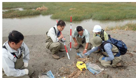
図-11 ネイチャー研究会inむかわと室蘭開発建設部との現地合同調査(平成28年8月出水後)

三つ目として、今夏大雨により鶴川河口周辺の変化について共通認識を持つことから、出水後の室蘭開発建設部による現地調査に、同会メンバーも同行願ひ、現地にて意見交換を実施した（図-11）。