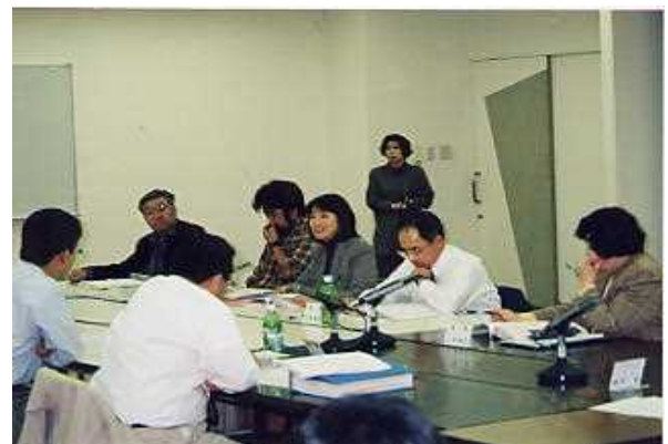
図-5 鵜川河口に関する懇談会

「鵜川河口に関する懇談会(平成8年10月発足)」は、鵜川の治水対策と干潟保全、河口に関する諸課題について、地域で活動されている方々、地域団体の方々、住民の方々、漁協、河川管理者がメンバーとなって意見交換を行ったものである。(図-5)