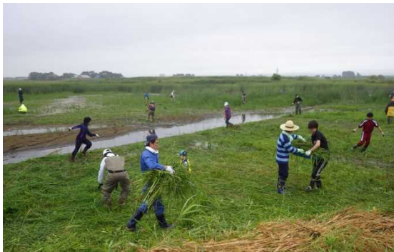
図-8 鶴川河口人工干潟除草（平成27年）

河川協力団体としての活動については、「鶴川河口人工干潟除草（参加42名）」「特定外来生物（オオハングソウ）防除（参加20名）」であるが、重労働にもかかわらず、団体の他、わくわくワーク・むかわメンバー、鶴川高校ボランティア部の方々、自治体、河川管理者が参加して、今年も継続して実施した。（図-8）