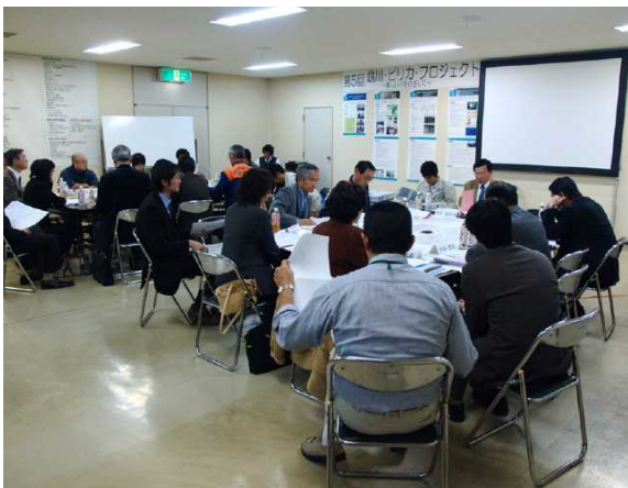
図-6 第5回鶴川・ピリカ・プロジェクト (平成19年12月)

「鶴川・ピリカ・プロジェクト(平成19年3月発足)」は、鶴川水系河川整備計画(平成21年2月)の策定と平行して、住民や行政などが、鶴川の現状と課題及び将来について話し合い、意見を共有し、協働の川づくりに向け、歴史・文化を尊重した、自然豊かな安全・安心の川づくりを行い、未来へ魅力あふれる鶴川を引き継ぐことを目的としたものである。プロジェクトは、NPO、地域団体、住民の方々、商工会・地域協議会・学校等の関係機関、河川管理者がメンバーとなり検討した。(図-6)