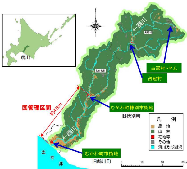
※平成18年の国土交通省作成の国土数値情報(土地利用メッシュ)より 図-1 鵜川水系位置図

名がそのまま町名に用いられたり、町民憲章「人と自然が輝く清流と健康のまち」をまちの将来像として定めるなど、鵜川との関わりが深い町である。また、下流の勇払低地にむかわ町市街地、中流部では、肥沃な農林業適地として農林業を主体として町の産業を形成してきた。