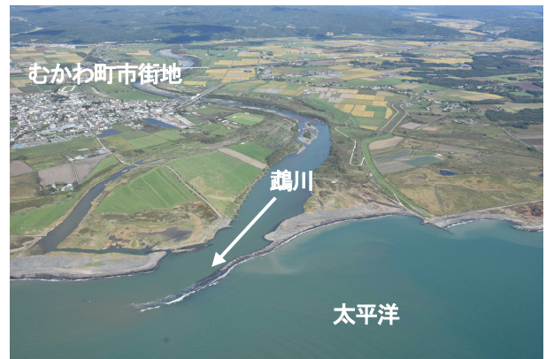
図-2 鵜川河口斜め写真(平成 28 年 9 月撮影)

鵜川は、日高山脈北部の狩振岳(標高 1,323m)に源を発し、占冠村、むかわ町を経て太平洋に注ぐ幹川流路延長 135km(全国 29 位)、流域面積 1,270km 2 (全国 52 位)の一級河川である。国管理区間は、河口から約 42km 区間であり、むかわ町の中央を流れる。清流鵜川は、多様な動植物が生息・生育・繁殖し、特にシギ・チドリ類が飛来し渡り鳥の中継地である河口干潟や、サケやシシャモなどの遡河回遊魚が遡上産卵するなど豊かな自然環境を有している。(図-1、図-2)