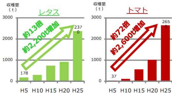
図-3 むかわ町トマト・レタス収穫量推移

このように、むかわ町の産業は、鵜川の水を活用しながら発展し、さらに集落を形成するなど、河川と大きな関わりを持っており、かわづくりがまちづくりの発展に寄与してきたと考えられる。また、鵜川の治水事業においては、市街地や生産空間の安全性を向上させ、浸水被害の減少を図ってきている。一例として、治水事業のストック効果では、治水事業などにより、地域の安全性が向上し、水稲に加えて、近年、レタス・トマトなどのハウス栽培へ転換が進められ、鵜川が育む「むかわのやさい」が急成長している。（図-3）