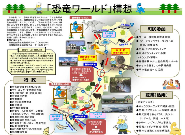
図-12 むかわ町「恐竜ワールド構想」（概要）

これらの計画を推進する基本戦略の一つとして、むかわ町内で発見された恐竜ハドロサウルス科に属する国内屈指の全身骨格化石などにより観光振興を図ることを目的に「恐竜ワールド構想（平成27年12月）」が策定されている（図-12）。構想では、「まちの魅力をみがく」「まちの魅力をみがいて交流人口を拡大する」を目標として掲げ、行政（学術研究含む）・町民参加・産業活用による町の活性化、観光入込客数増加に期待している。また、鶴川流域に沿うようにむかわ町全域をステージとした展開を推進することとしており、地域の構想に鶴川が大きな役割を担っている。