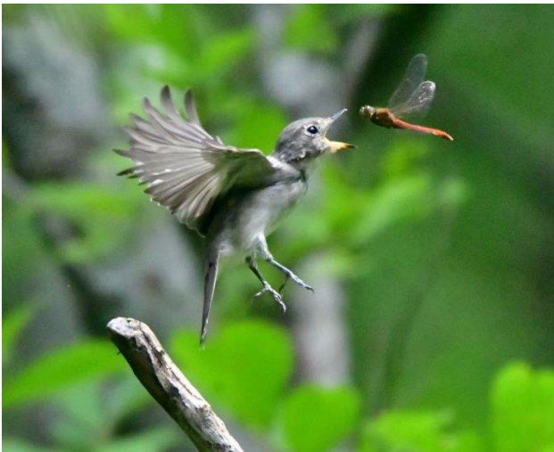
2022年度最優秀作品「コサメビタキのモグモグタイム?」