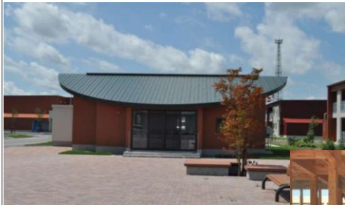
集会所・みんなの広場