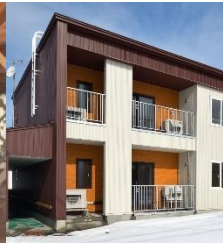
バルコニー側外装材

また、当団地は田園地帯に立地することから高さを抑え景観に配慮し、外観は町の歴史的建造物と同系色とし、構造材や外装材に栗山町産のカラマツを使用することで、地場産業の振興にも寄与するなど、優れた創意工夫により、住環境を向上させた。