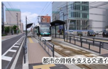
都市の骨格を支える交通インフラの整備（支援イメージ）

以下バーコードから地域公共交通の「リ・デザイン」に向けた事業の詳細を確認出来ます。（バーコードをクリックしてもアクセスできます。）