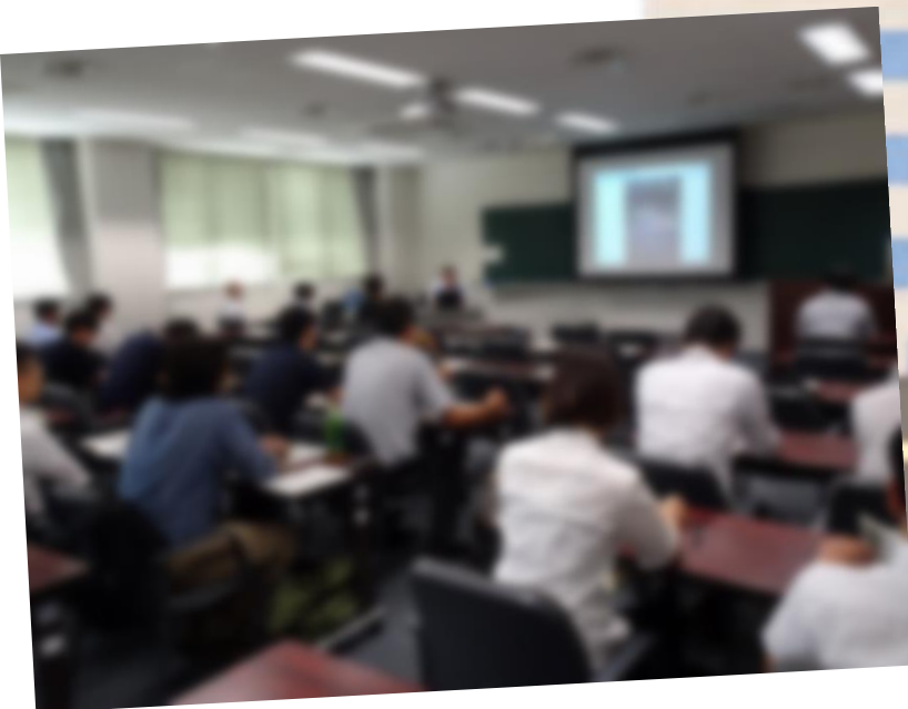
←説明会当日の様子

まだまだ普及率が低い無電柱化ですが、今年8月に北海道の自治体を対象にした無電柱化の説明会を開催しました！！ 当日は現地とWEBの併用開催で各省庁、開発局における取組の紹介、自治体の検討状況等の紹介・説明会を開催しました。