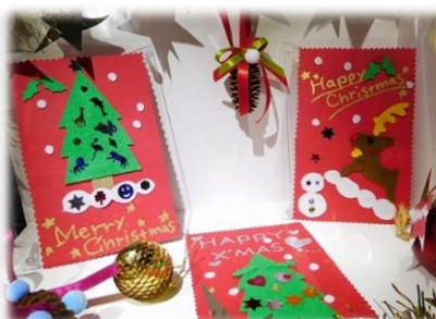
フェルトdeデコレーション