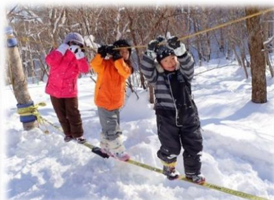
滝野の森ゾーンの雪遊び