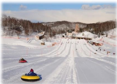
200mのチューブそりコース

国内最大級「200mチューブそりコース」や森の中での雪遊び、スキー教室、クロスカントリースキーコースやスノーシュー体験など、冬の楽しみがいっぱいの『滝野スノーワールド』へ、楽しい思い出づくりにご来園ください。