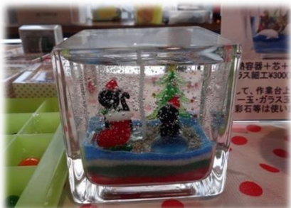
ジェルキャンドル作り

クリスマスにちなんだクラフト作り(オープン日からクリスマスまでの3日間)やお正月らしい工作教室など、親子で楽しめる屋内でのイベントもたくさん開催します。