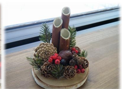
森の素材でミニ門松づくり