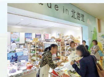
出典：<道新ふらす>2月までの限定ショップ「Made in 北海道」首都圏進出へ道産品を応援 2016/10/24 北海道新聞朝刊全道(特集)

道外であまり知られていない道産品を紹介し販売する期間限定のアンテナショップ「Made in 北海道」(北海道商工会連合会や北海道新聞社などでつくる実行委員会の主催)が東京都港区台場の複合施設「アクアシティお台場」に開設され、買い物客でにぎわっています。