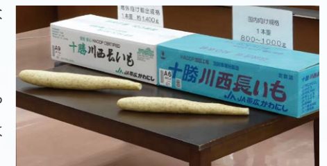
青は国内向け、白は4Lサイズが入る海外向け。海外では長いものの方が人気。

特に北海道が全国生産の4割以上を担う「長いも」がアジア圏や北米でも好評で、十勝管内8農協で作る「十勝川西長いも」はHACCP認証を受け、安全安心な道産品として輸出されています。