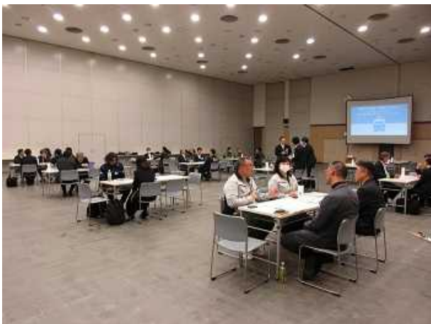
1on1ミーティングの様子