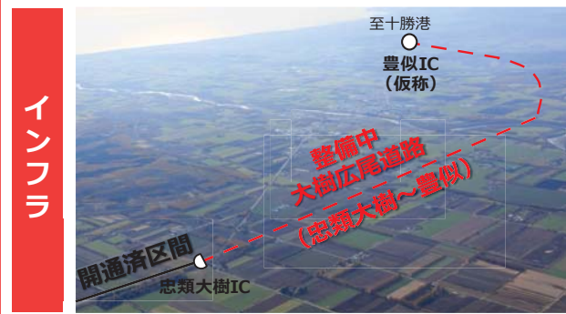
整備中 (大樹広尾道路)