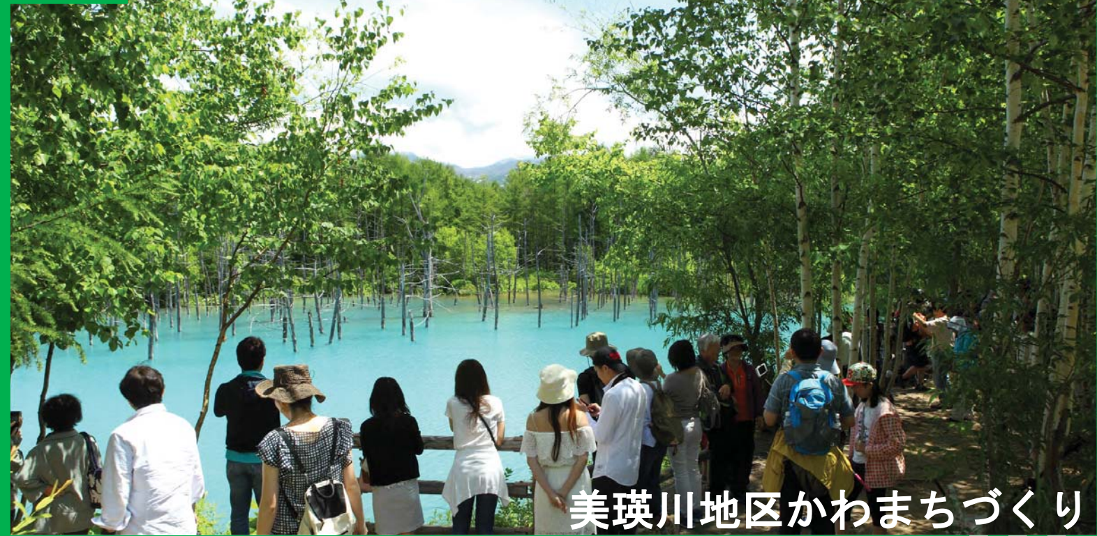
美瑛川地区かわまちづくり