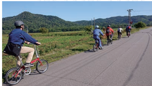
まちなかサイクリング ポタリング編(折畳自転車)

そんな小さな村の重要な生活道路である「村道」から見える景観はのどかで牧歌的であり、今では風光明媚な自然景観とともに「村道」も大事な観光資源の一つとなっています。