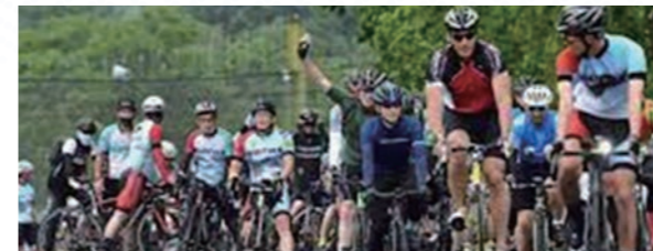
鶴居サイクルスポーツ振興会と協力して開催したサイクルイベント「鶴居チャレンジライド」

サイクルツーリズム推進のための活動を続けてきたところ、触発された村内の若手住民により、新たにサイクルスポーツの普及や自転車のイベントを実施する「鶴居サイクルスポーツ振興会」が発足。サイクルイベントの開催で協力・連携するなど活動の幅が大いに広がり、鶴居村をサイクリングの聖地にすべく村一丸での活動となっています。また、宿泊客数や外国人観光客の増加といった具体的な効果が現れており、中長期滞在型観光の宿泊数も着々と増え始め、リピート率も高く、毎年鶴居村で過ごす観光客も増加しています。