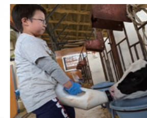
酪農体験 仔牛にミルクを