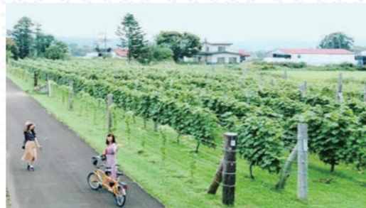
まちなかサイクリングブドウ畑