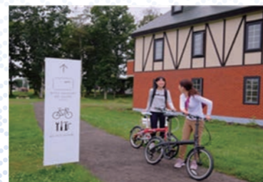
女子に人気のポタリングジャーニー