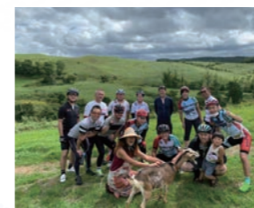
村民と交流するロードバイクツアー