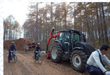
林道でのサイクリング