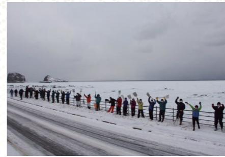
流水が見えるようになった海を背景に 雪かき参加者で集合写真撮影

流水景観が見えるよう地域主体で取り組む一体感や満足感を通じて、道路は地域のものとして「大切に維持し価値を高めよう」という意識が広がっています。また、SNSなどでの開催・参加の声かけによる参加者が増加しており、綺麗な流水景観を楽しみ写真撮影する来訪者の光景も多く見られるようになりました。