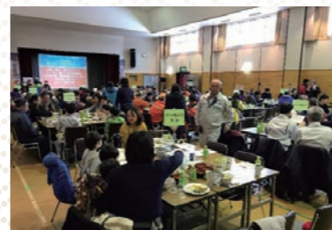
避難訓練後の地区防災計画 意見交換会の様子