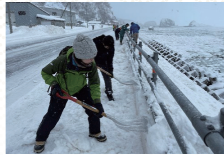
道路沿いガードレール部分を 除雪している様子