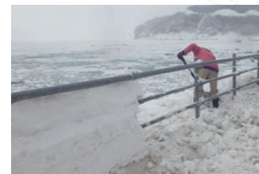
除雪前(左側)と 除雪後(右側)の流水景観

体験要望のある観光客にはスコップ等を貸与し、誰もが気軽に参加できる環境を整えており、近年は、冬期避難訓練とあわせて実施し、地域の冬の災害に対する備えにも貢献しています。