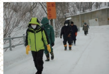
雪かき後の避難訓練状況