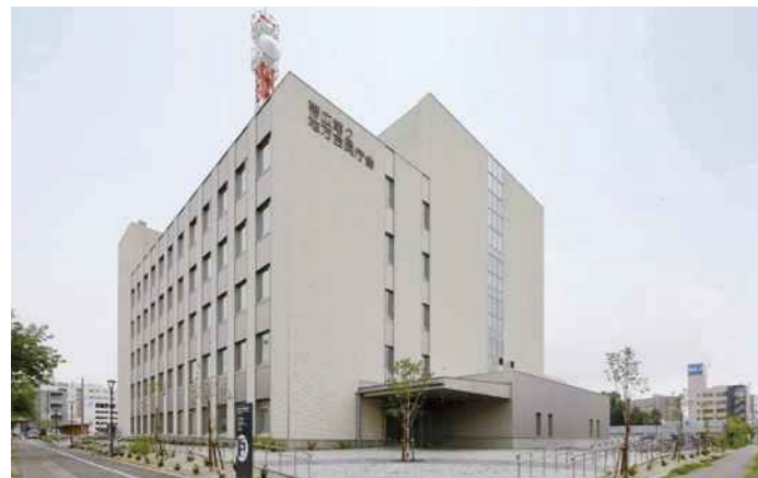
帯広第2 地方合同庁舎

帯広市内にある国の3 官署(財務事務所、税務署、開発建設部)を集約・合同化することで、利用者の利便性を向上させ、災害時にも地域に貢献する施設を整備しました。