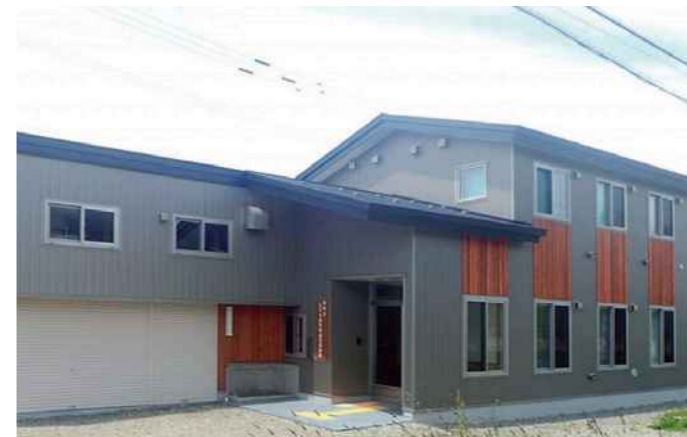
えりも自然保護官事務所

小樽市内にある国の様々な機関(11 官署)が入居しています。港湾地域に分散する庁舎機能を集約し、利便性の向上、執務環境の改善及び防災拠点としての安全確保を目的として整備しました。