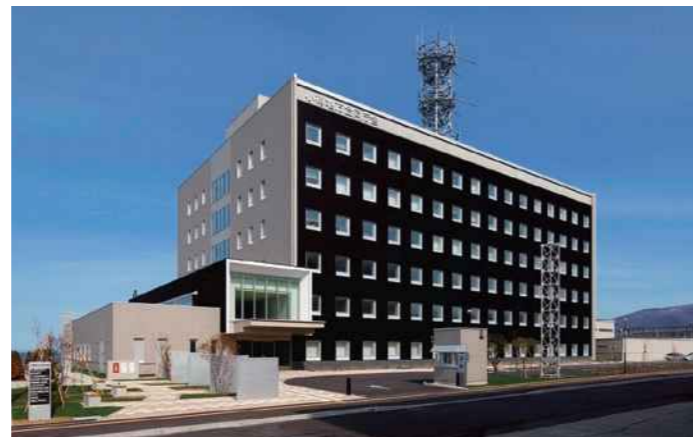
小樽地方合同庁舎

帯広市内にある国の3 官署(財務事務所、税務署、開発建設部)を集約・合同化することで、利用者の利便性を向上させ、災害時にも地域に貢献する施設を整備しました。