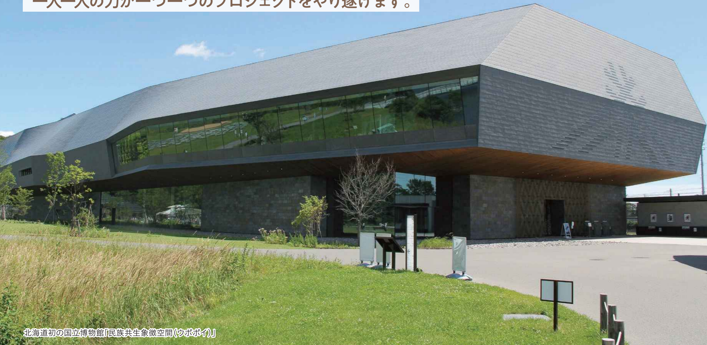
北海道初の国立博物館「民族共生象徴空間(ウポポイ)」