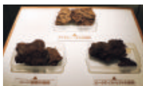
泥炭(篠津泥炭資料館)

わが国において泥炭地の大部分は、気象条件が揃っている北海道に分布していますが、小面積ながら、東北地方から九州地方にわたって散在しています。