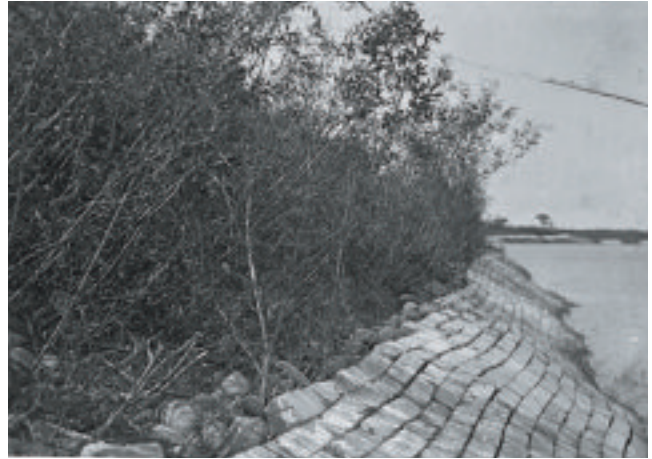
岡崎式単床ブロックの据え付け

また、岡崎式河川改修の基礎技術である「岡崎式単床ブロック」は、石狩川治水事務所長在任中の明治43年(1910)から大正6年(1917)に石狩川(現・茨戸川)に施工されました。工事コストが安く、強度と耐久性、施工性などに優れた「岡崎式単床ブロック」は、その後も天塩川や十勝川でも施工され、さらに利根川、鬼怒川など全国の河川に広まったほか、アメリカのミシシッピー川にも導入されました。