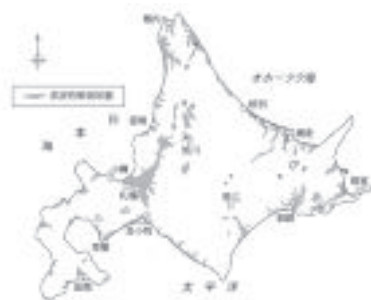
北海道の泥炭性軟弱地盤の分布

なかでも、石狩川の中～下流域では、雨竜川、空知川、幾春別川、夕張川、千歳川および豊平川が合流し、これらの河川流域には、氾濫による肥沃な沖積土地帯と低温多湿による広大な泥炭地帯が形成され、石狩泥炭地と呼ばれています。3,000～7,000年前から盛んに泥炭が堆積するようになったと考えられており、泥炭の厚さは、一般に5m程度のところが多くなっているようです。