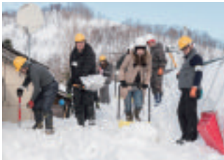
除雪ボランティア(岩見沢市)