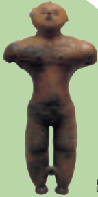
「国宝 土偶」 函館市著保内野遺跡出土