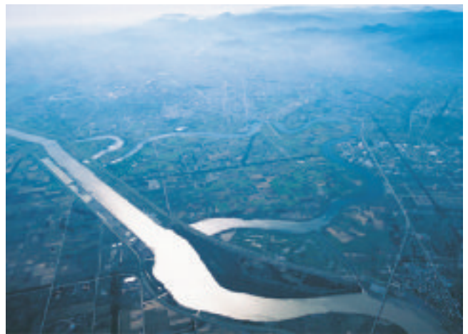
生振捷水路（土木学会選奨土木遺産）

河川延長は 74.3 km（うち捷水路工事によるもの 58.1 km、自然短絡によるもの 16.2 km）も短縮されています。