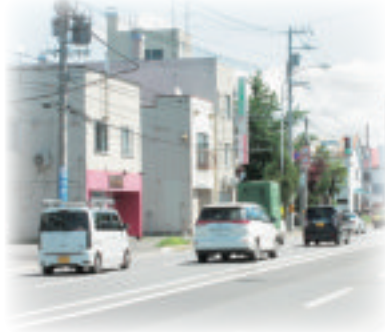
旭川市9条通(旧大黒市場前) (左)昭和39年(旭川市中央図書館所蔵) (右)平成29年