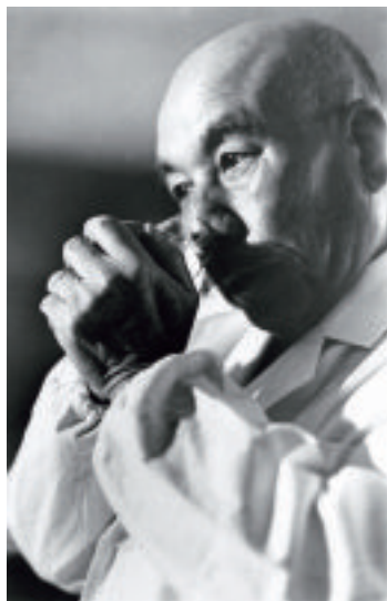
竹鶴政孝

竹鶴は大正9年(1920)に帰国。大正12年(1923)には、「株式会社寿屋 ことぶきや 」(現・サントリーホールディングス株式会社)に入社し、昭和4年(1929)には京都・山崎で国産第一号となるウイスキーを誕生させます。しかし、自分の理想とするウイスキーづくりを追求するために、独立を決心しました。