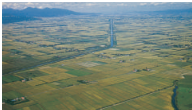
石狩平野（水田整備後の篠津地域）

泥炭に阻まれていた石狩川流域の篠津地域は、入植時の経営面積は小さく、泥炭地の過湿や地力不足のための低生産地として甘んじてきましたが、この事業によって、大規模で生産性の高い水田へと転換。わが国を代表する稲作地帯に成長し、専業経営による大規模農業が可能となりました。