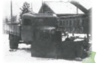
国内初の除雪トラック (昭和18年)