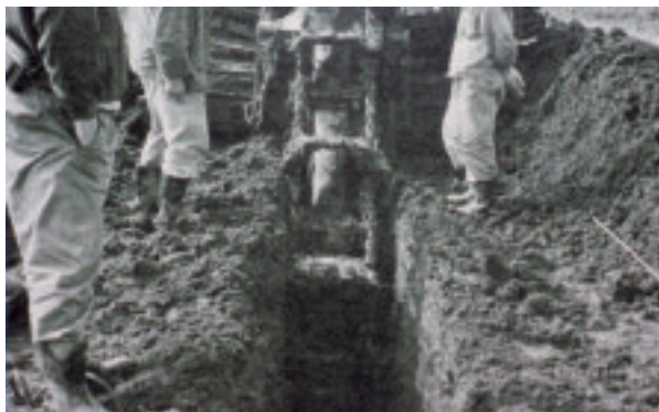
トレンチャーによる暗渠の掘削状況