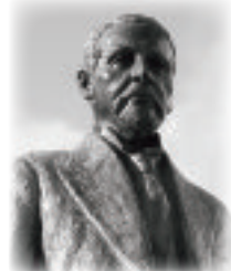
クロフオード銅像