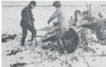
篠津原野の泥炭地で作業中に自重で沈んだブルドーザ

ながら、昭和29年（1954）に三角形断面の履板を装着し、接地圧を低下させたブルドーザの改良に成功しました。このブルドーザは、履板に泥がつかない、泥炭の繊維を切らない、軟弱地の走行可能、横滑りにくいなどの利点を備えていて、軟弱地盤での農地造成で活躍するとともに、今日の湿地用ブルドーザの基本となりました。