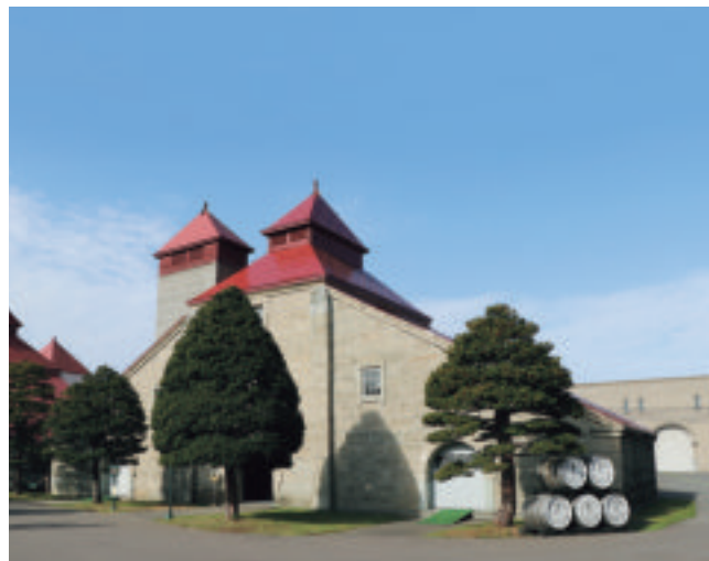
ニッカウキスキー余市蒸溜所

以来、ニッカウキスキー余市蒸溜所は、当時と同様の製法でウイスキーの蒸溜、貯蔵を行っています。