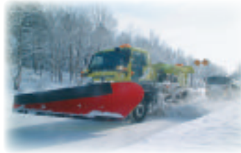
多機能型除雪トラック 凍結防止剤散布装置搭載 (平成12年以降)