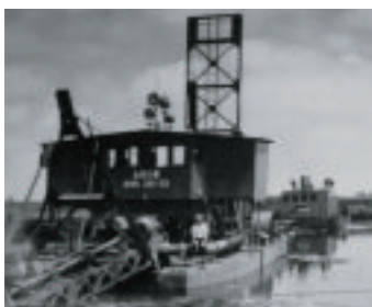
浚渫船しのつ号