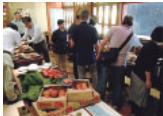
香港における試食商談会