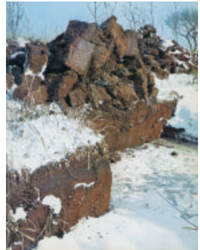
農耕に不適だったかつての篠津原野(左)と篠津の泥炭(右)