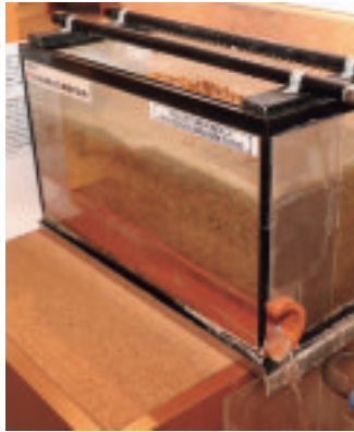
暗渠排水のイメージ

「水」と「土」を制御して、豊かな大地を拓いてきた泥炭地開発の技術。国民の食を支え、命を支える「技」は、石狩平野をダイナミックに拓き、農業生産の安定と地域経済の発展に今もなお貢献し続けています。