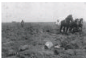
泥炭地の掘り起こし

北海道には、約2,000 km 2 にも及ぶ泥炭地が分布しているとされており、北海道の総面積の約2.4%、平野部面積の約6%に相当します。分布域は石狩平野、サロベツ原野、釧路湿原などが有名で、空知、石狩、上川、宗谷、釧路、十勝管内などの河川下流域に多く分布しています。