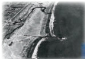
建設前(昭和26年)