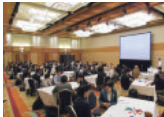
北海道価値創造 パートナーシップ会議