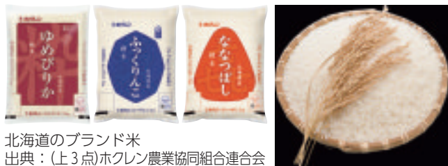
北海道のブランド米

北海道の農産物といえば、ばれいしょ（じゃがいも）や小麦、たまねぎが有名です。これらは全国でも第1位の生産量を誇る農産物ですが、実は、北海道はお米についても全国トップクラスの大生産地。広大な大地と恵まれた水資源を生かし、大規模な水田が道内各地で営まれ、作付面積