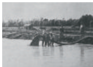
ポンプ送泥客土

この工法は、施工工程が簡単であり、最も経済的であるなどの利点を有していましたが、前例のない新しい工法であったため、多くの問題を解決する試行錯誤を重ねた末、実施に移されました。