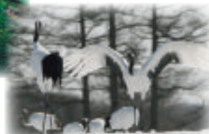
釧路湿原とタンチョウヅル