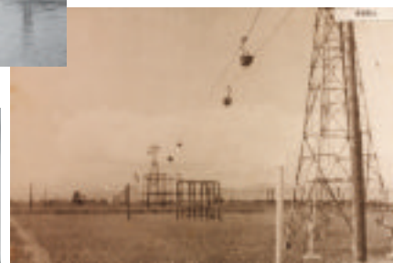
美唄地区で行われた空中ケーブルによる索道客土（昭和43年ごろ）

※索道客土：荷載場から荷降場までの約4.7 kmに33基の鉄塔を設け、その間の空中に鋼鉄の綱を張り渡して運搬機を吊り動かし、土を運搬するもの