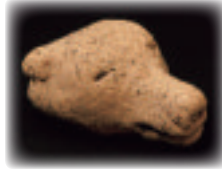
クマタ製品 モヨロ貝塚出土