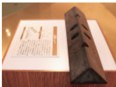
湿地用ブルドーザに装着された三角形履板（三角シュー）