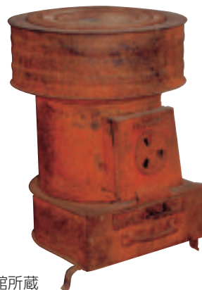
泥炭ストーブ