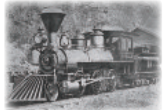
第 2 番機関車弁慶号ノ図(明治 13 年)