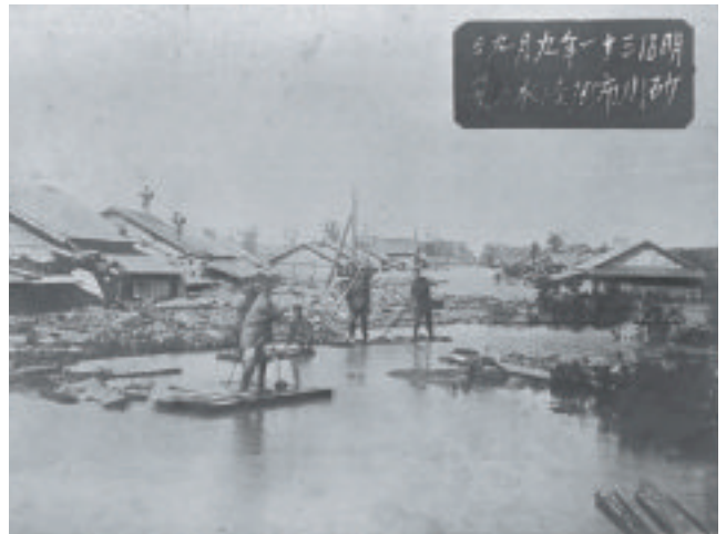
砂川市街浸水ノ景

この惨禍から根本的な治水計画の必要性が認識され、北海道庁内に「北海道治水調査会」が設けられたほか、石狩川の本格的な基本調査が実施されました。