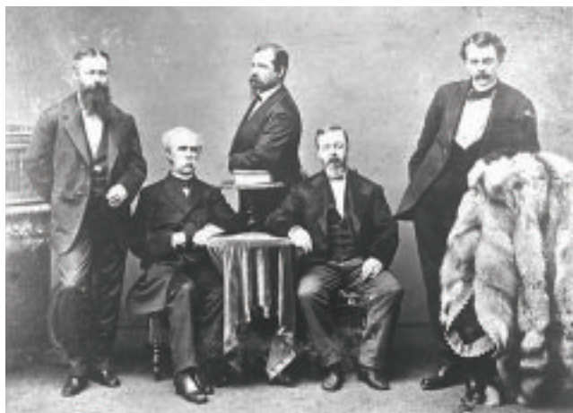
お雇い外国人(左から二人目がホーレス・ケプロン)

明治政府と開拓使は、北海道の開拓を進めるためには、先進国である欧米から高度な学問や技術を身につけた人間を連れてくるのが有効だと考え、開拓次官（当時）の黒田清隆は、アメリカ合衆国連邦政府の農務局長ホーレス・ケプロンを御雇教師頭取兼開拓使顧問として迎えました。ケプロンは、アメリカから次々に優秀な人材を呼び寄せ、農業、工業、鉱業、医学など、多様な分野に「お雇い外国人」を送り込みました。