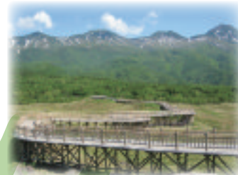
世界自然遺産『知床』とヒグマ