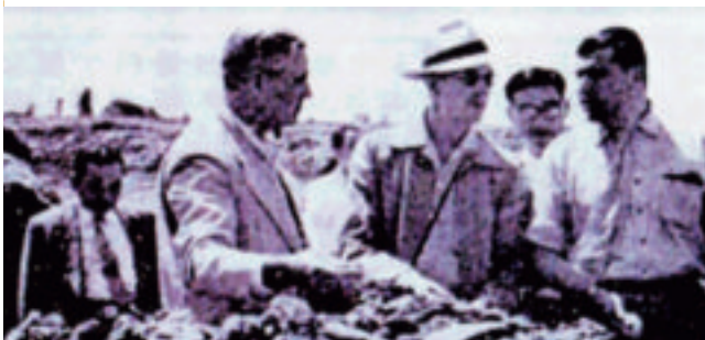
世界銀行農業調査団による石狩泥炭地開発事業の調査(昭和29年)

こうして、食糧増産対策と経済安定などに資することを目的とした「篠津地域泥炭地開発事業」は、昭和30年(1955)、世界銀行の融資を受けて進められることとなりました。