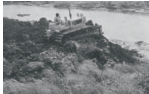
篠津原野での湿地用ブルドーザ