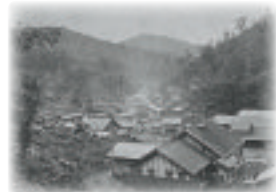
幌内炭山之景(明治 10 年代末)